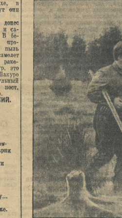
Чкалов любил свои родные места: Горький, Волгу, Васильев, Стратный охотник, с дуэльной в руках, он нередко бродил по полям и лесам своего района. На снимке: Чкалов на охоте.

В голубом небе ровный Мотушиный гусь. И вальсировать, и танцевать, и летать, и вальсировать, и танцевать, и летать, и вальсировать, и танцевать, и летать. И вальсировать, и танцевать, и летать, и вальсировать, и танцевать, и летать, и вальсировать, и танцевать, и летать, и вальсировать, и танцевать, и летать. И вальсировать, и танцевать, и летать, и вальсировать, и танцевать, и летать, и вальсировать, и танцевать, и летать, и вальсировать, и танцевать, и летать.