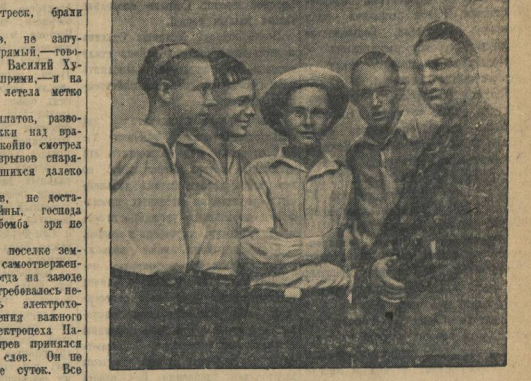
«Бьет таким, как Чкалов!» — завелась мечта советской молодежи. Чкалов любил советскую молодежь, часто встречался с пионерами, школьниками, допризывниками, беседовал с ними, высказывал в них благородные чувства любви и родины, преданности партии. На снимке: Чкалов среди допризывников Чкаловского района. (1938 г.).