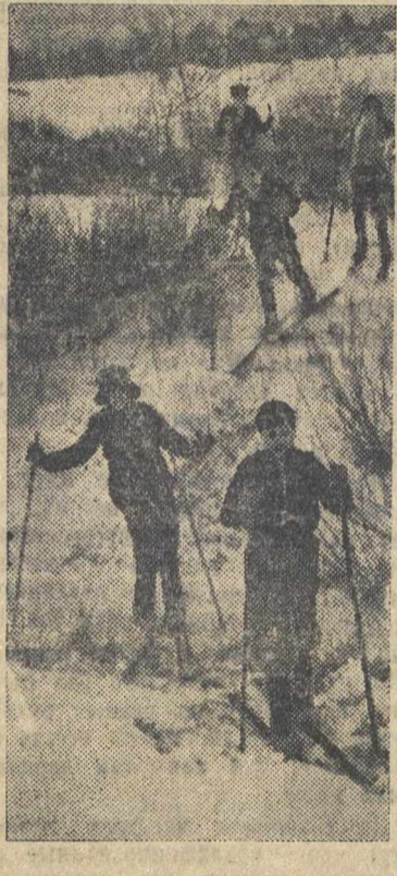
Зимний пионерский лагерь в Филипповке. На снимке: лыжная вылазка.