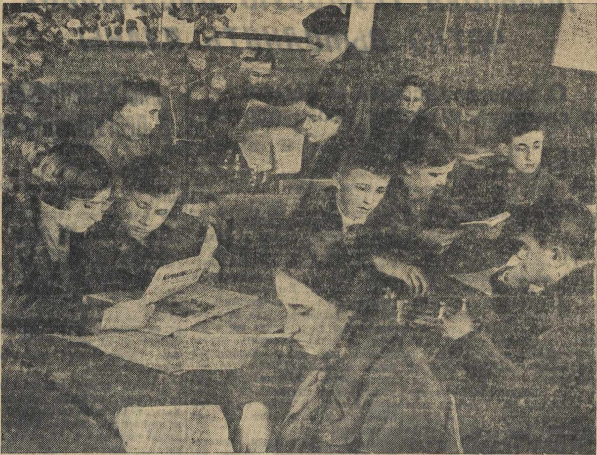
Зимний пионерский лагерь в Филипповке. На снимке: в читальне.