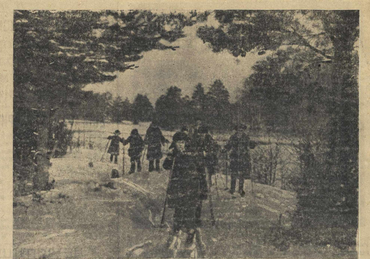
Веселые школьные минувшие. На снимке: лыжная прогулка школьников, отдыхающих в Ниселинском пионерском лагере, по берегу Линды.