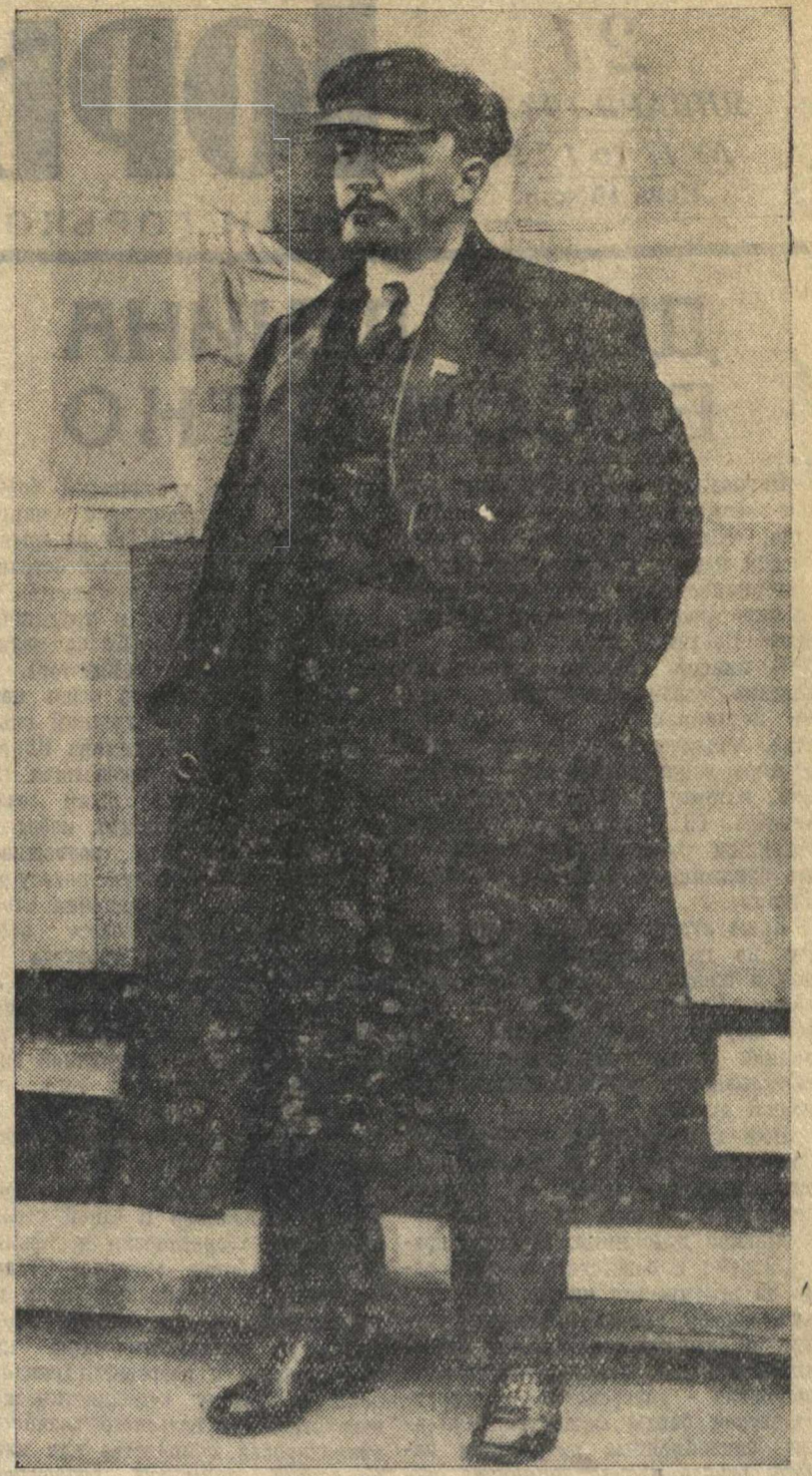
В. И. ЛЕНИН. (Декабрь 1919 г.)