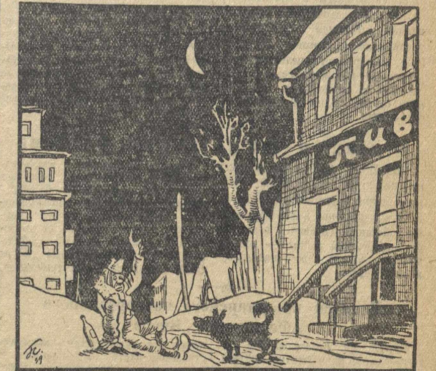
— Меня?.. Уволили за прогул! Такие работники, как я, на дороге не валяются...