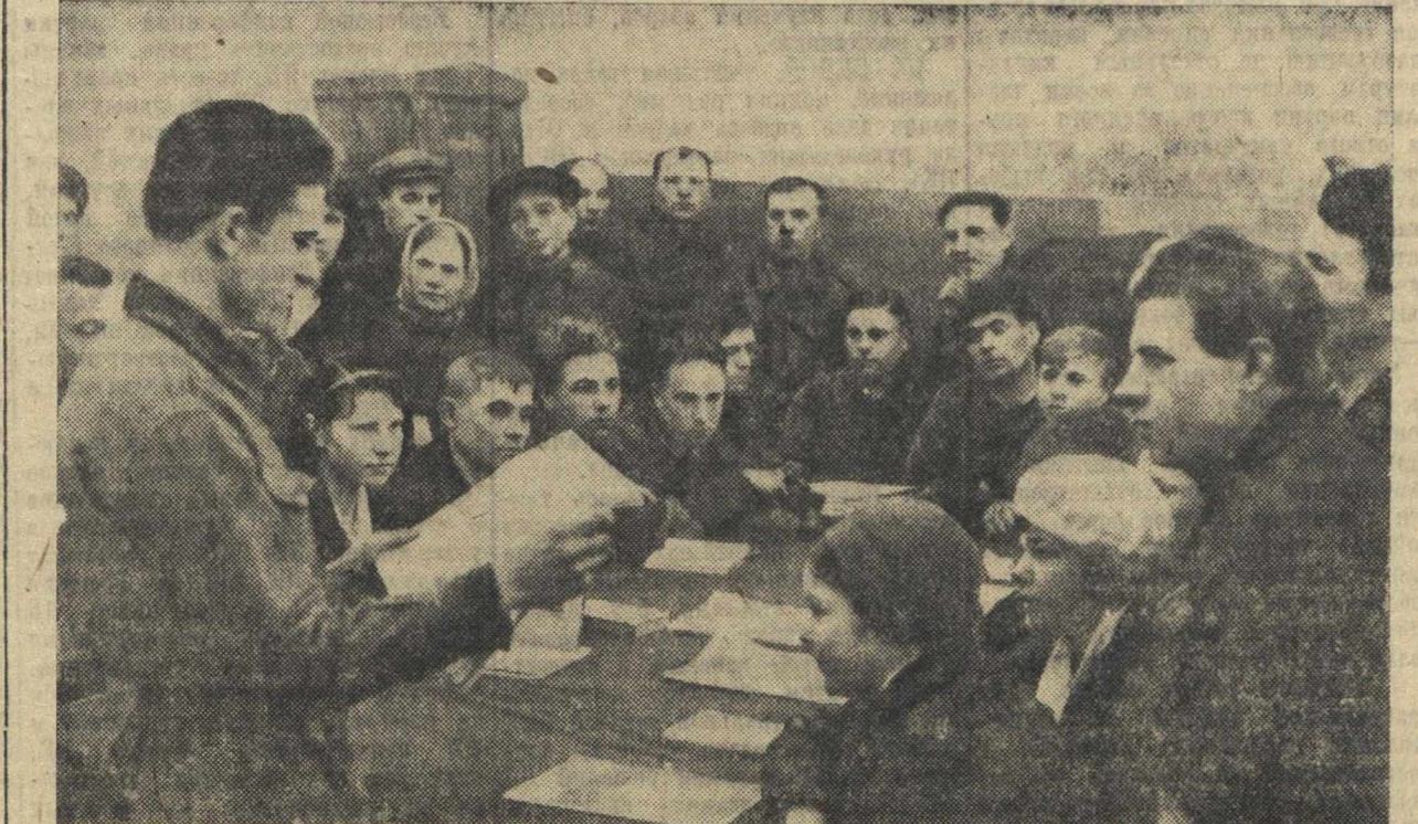
Митинг в электроремонтном цехе завода им. Кагановича, посвященный соревнованию имени XVIII съезда ВКП(б)