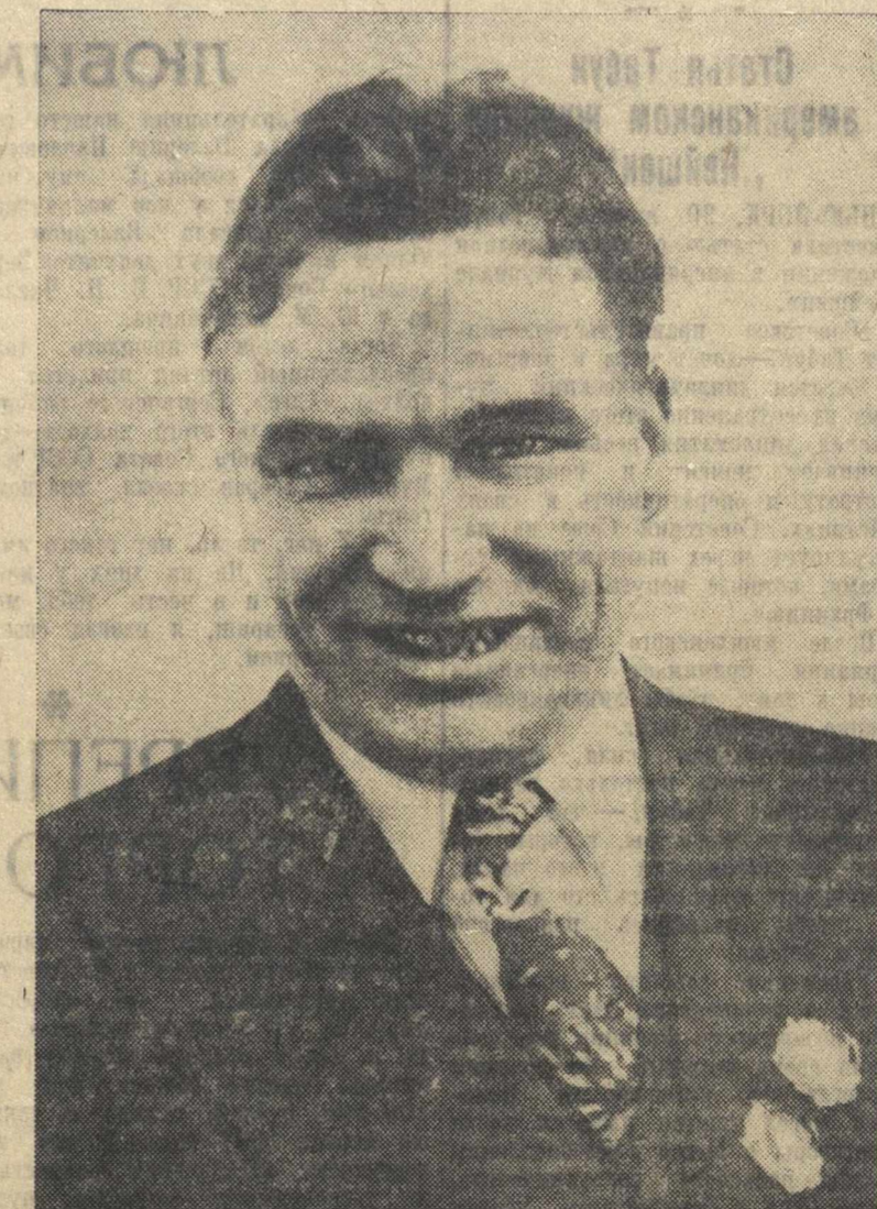
ВАЛЕРИЙ ПАВЛОВИЧ ЧКАЛОВ.