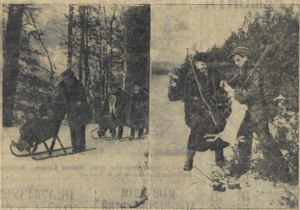
160 студентов горьковских вузов проводят каникулы в Серезинском доме отдыха. На снимках: слева — в парке; справа — на охоте.