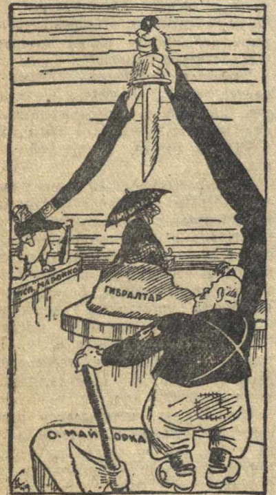
«Равновесие» сил на Средиземном море.

Испанский остров Майорка фактически превращен в итальянский остров, а Испанское Марокко оккупировано Германией.