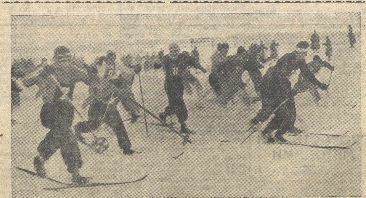
Спартакиада ИВД. Старт лыжной эстафеты 4x10 км.