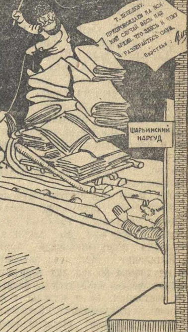
Трогательная переписка Шарьинского нарсуда с истцами.