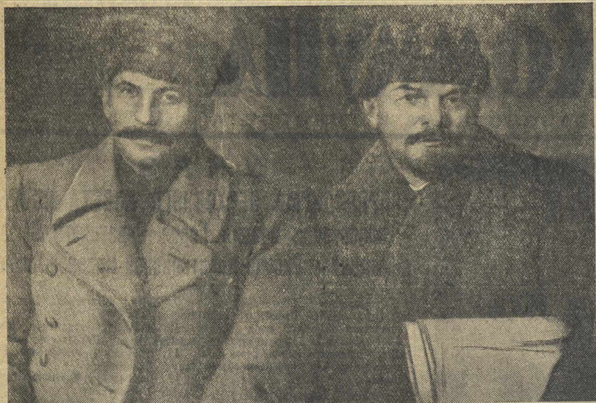
И. В. Сталин и В. И. Ленин. (Снимок сделан на VIII съезде РКП(б) в марте 1919 г.)