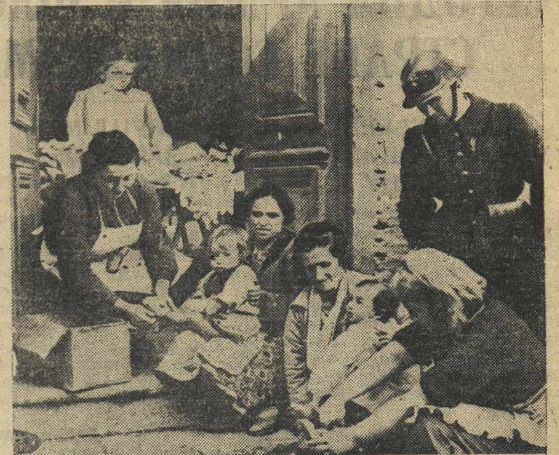
Трудящиеся Франции относятся к беженцам из Каталонии с огромной симпатией и стараются облегчить их крайне тяжелое положение. На снимке: трудящиеся французского пограничного города Булю радуют белье и обувь детям беженцев.

Принято на общезаводском собрании инженерно-технической интеллигенции Горьковского автомобильного завода имени товарища Молотова 17 февраля 1939 г.