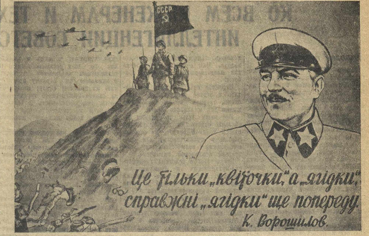
«Это только «цветочки», а «ягодки», настоящие «ягодки» еще впереди». (Плакат, выпущенный украинским издательством «Искусство»).