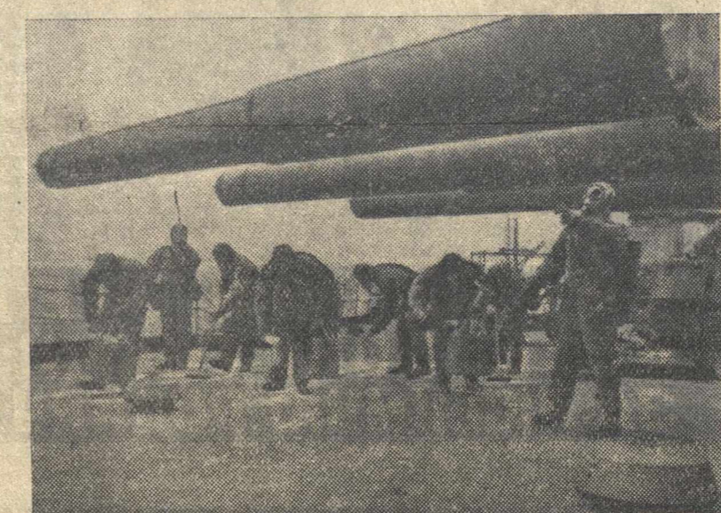
Дегазация палубы во время учебной химической тревоги на линкоре «Парискара коммуна».