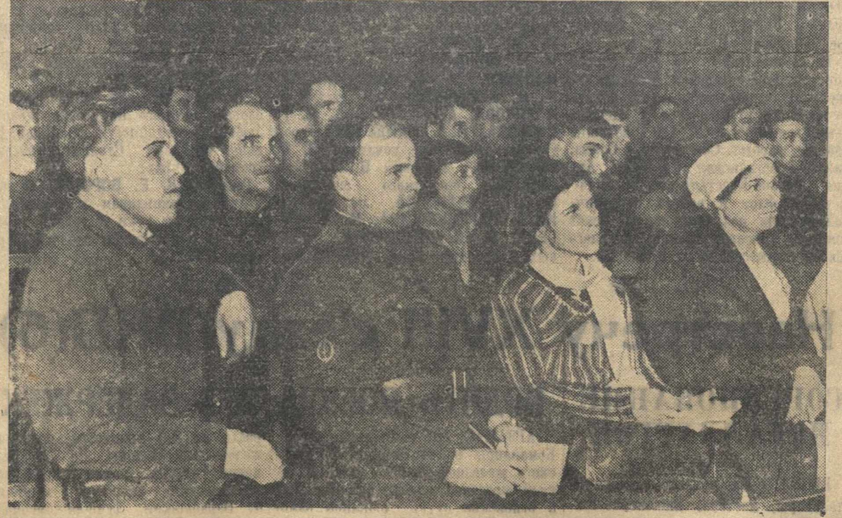
На Шахунской районной партийной конференции.

Победа колхозного строя в деревне, рост продукции социалистической промышленности создали все условия для развертывания сельской торговли.