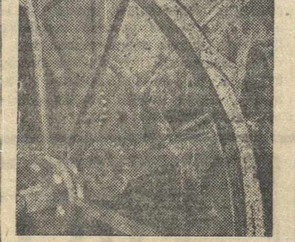
Механик колхоза «Красное Знамя», Истовского района, за ремонтом сельскохозяйственных машин.

Сейчас во всей Лукояновской межрайонной мастерской обработка поршневых пальцев производится по методу тов. Деманова. Сам Деманов, работая на шлифовальном станке, выполняет норму на 200—300 април.