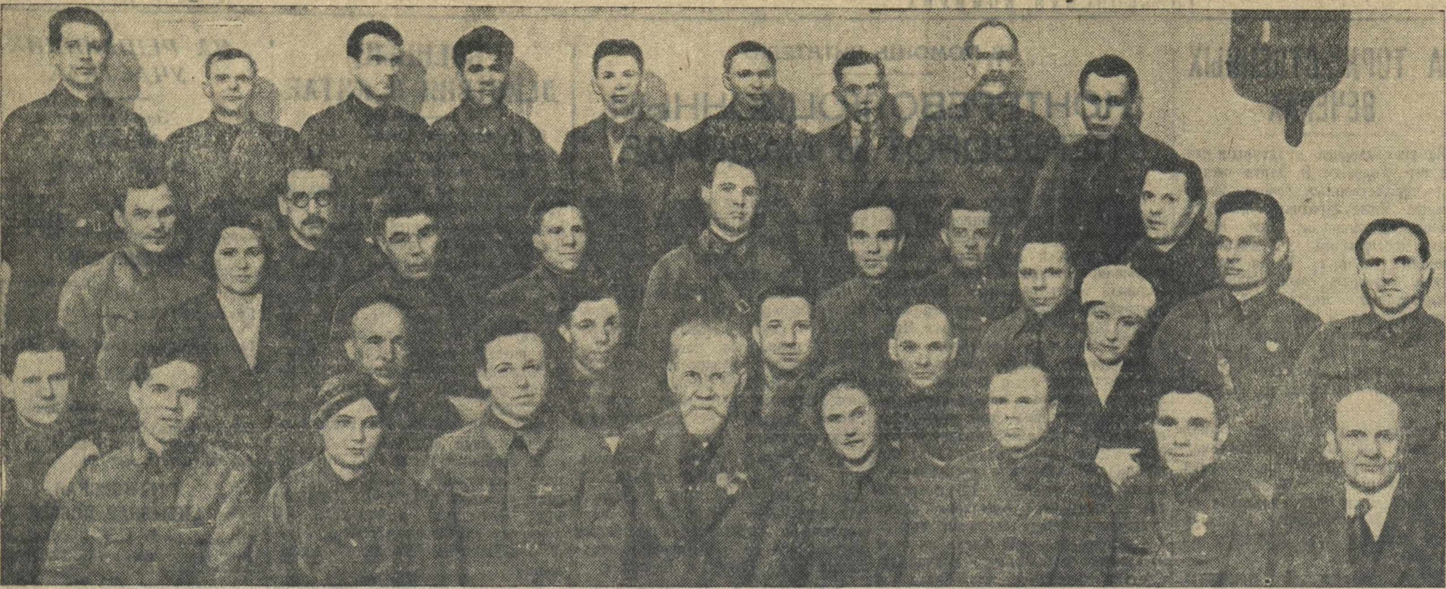
Группа делегатов Горьковской областной партийной организации на XVIII съезде ВКП(б).