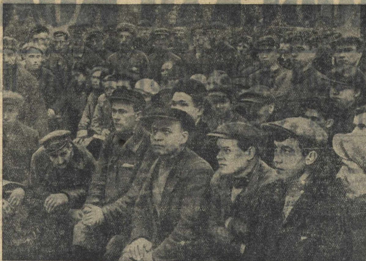
В цехах завода имени Воровского состоялись митинги, посвященные открытию XVIII съезда партии. На снимке: на митинге в токарном цехе.