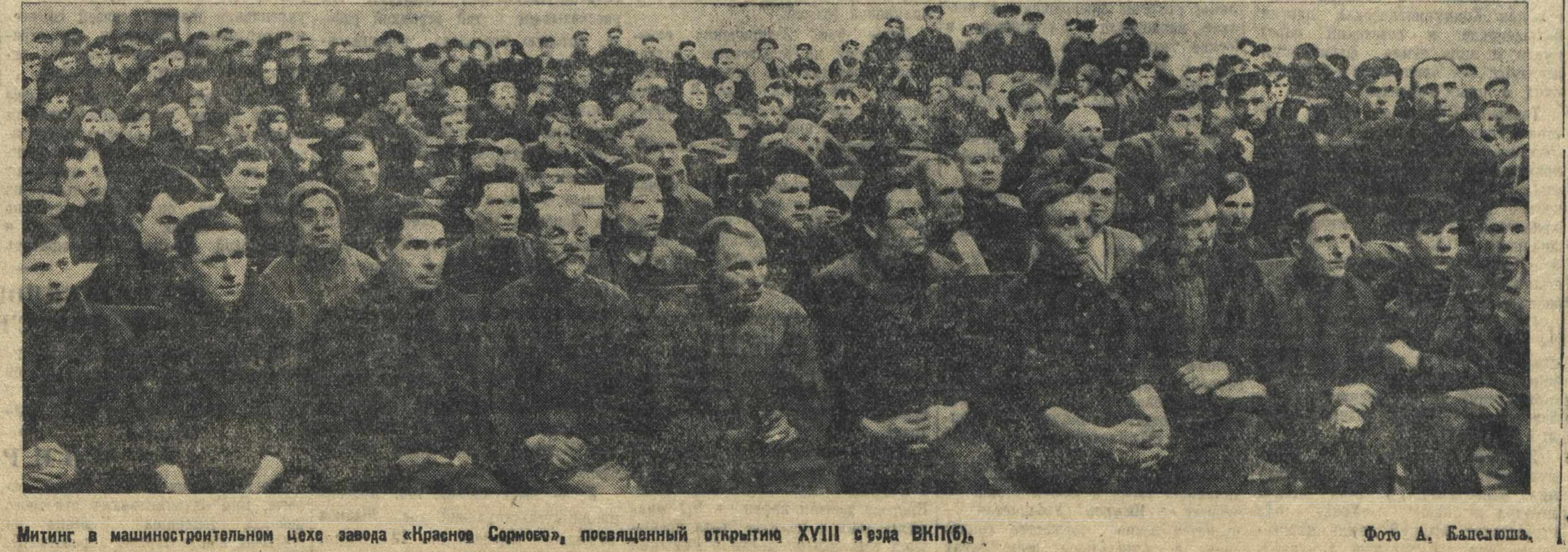
Митинг в машиностроительном цехе завода «Красное Сормово», посвященный открытию XVIII съезда ВКП(б).

Зеркальная артель «20 лет РККА» (Горьковский) выполнила квартальный план на 124 проц., Малышевская артель — на 104 процента. Львовский лесопункт Семеновского лесопункта выполняет план первого квартала по заготовке древесины на 100,1 проц. и по вывозу на 100,5 проц. Славинский, нач. лесопункта. С честью справились с этой задачей рабочие Арзамасского машиностроительного завода накануне XVIII съезда ВКП(б) они выполнили квартальную программу. На автозаводе организовано 100 стахановских школ. Голыцын.