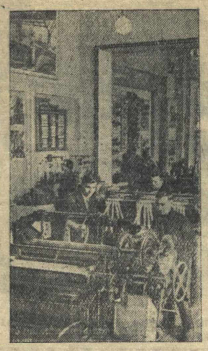
В Политехническом музее (Москва) открылась выставка новой техники машиностроения. На снимке: вид демонстрационного зала.