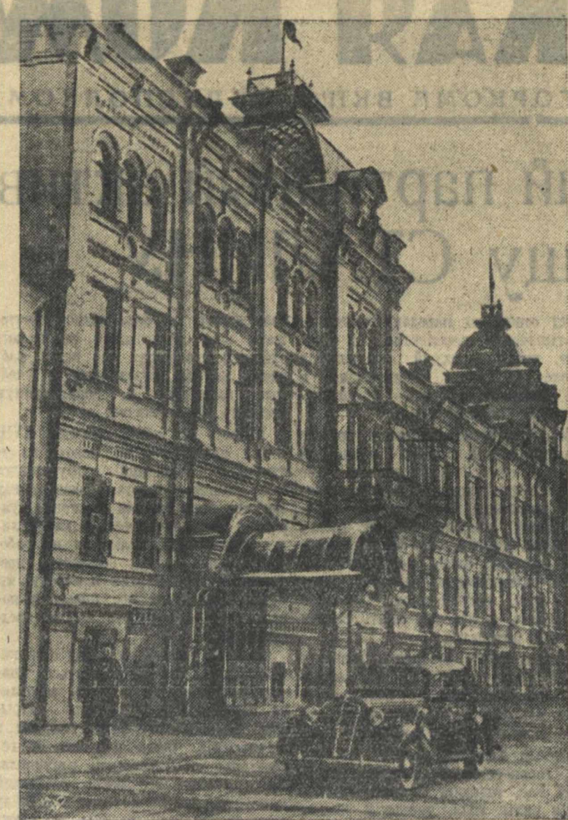
Внешний вид Областного дома партийного просвещения.