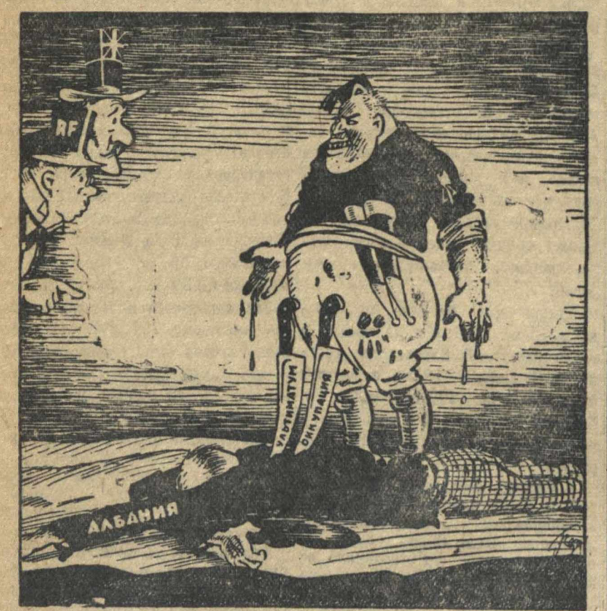
— Не откажите в любезности объяснить, что здесь произошло?..