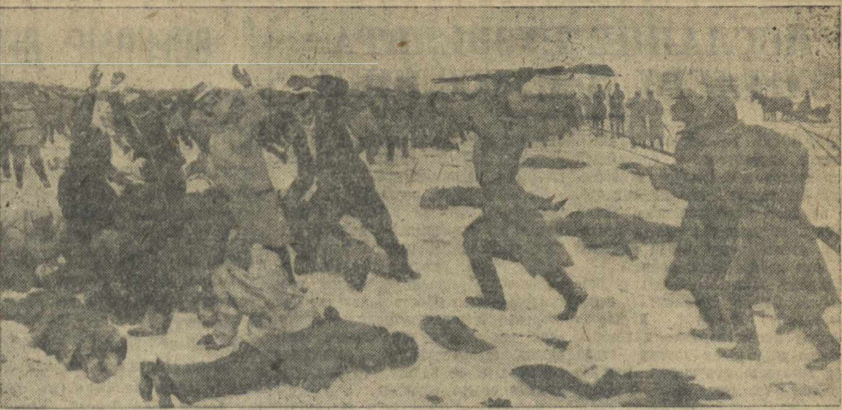
«На Лене после расстрела». (Картина заслуженного деятеля искусств К. Ф. Юона).