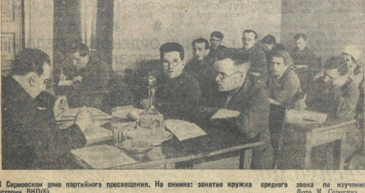
В Сормовском доме партийного просвещения. На снимке: занятие кружка среднего звена по изучению истории ВКП(б).

До создания нового района рост парторганизации за счет лучших людей Заветугужья шел медленно.