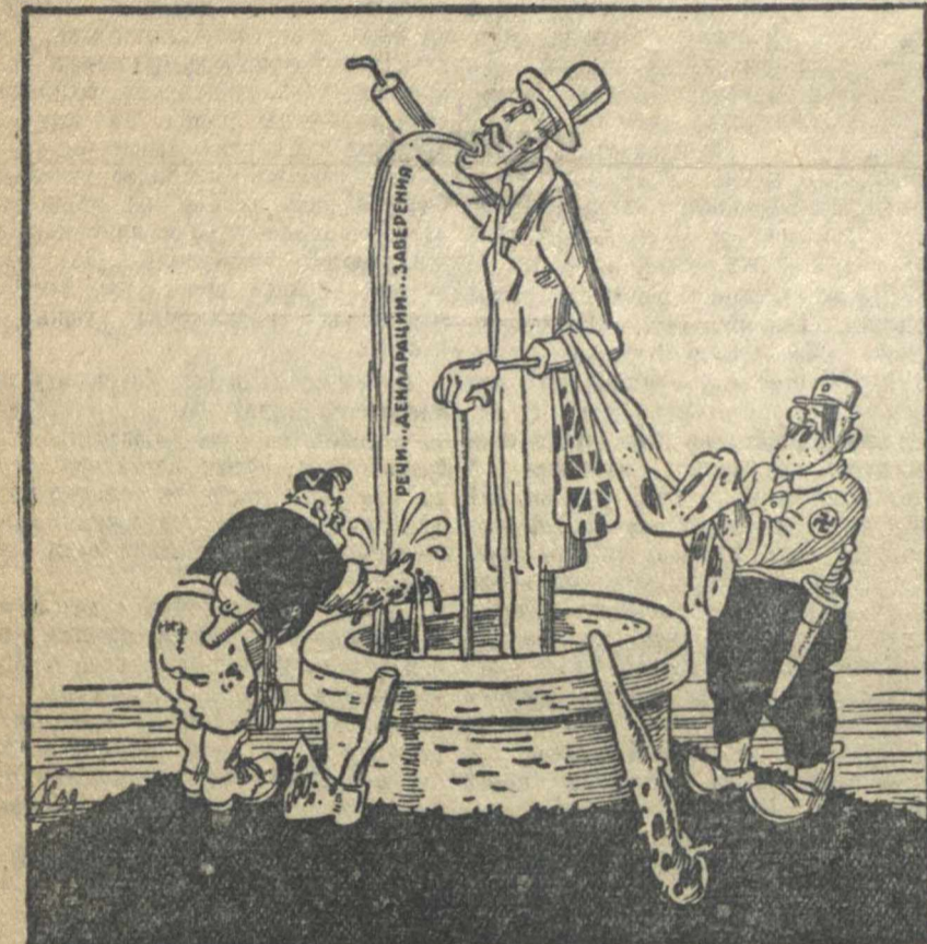
Неиссякаемый британский источник.