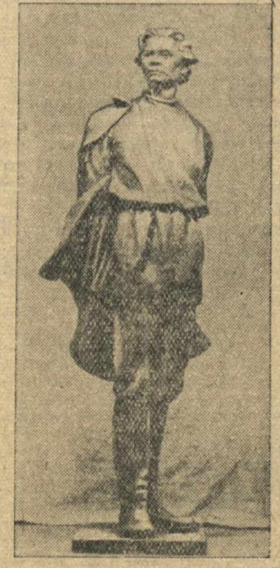
А. М. Горький. Работа скульптора В. И. Мухиной (бронза), которая будет установлена в павильоне СССР на Международной выставке в Нью-Йорке.