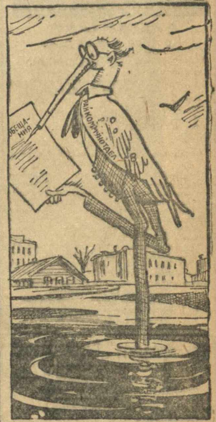
Кулик, который на своем болоте не очень-то велик, но во всяком случае доволен...