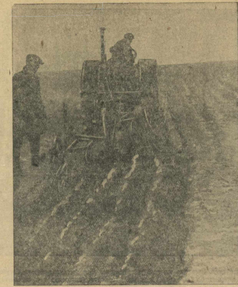
Сев в колхозах Дальне-Константиновского района. Транспортер отрял № 10 Тамбовской машинно-тракторной станции выехал на весеннюю пахоту в колхоз им. Л. М. Кагановича.