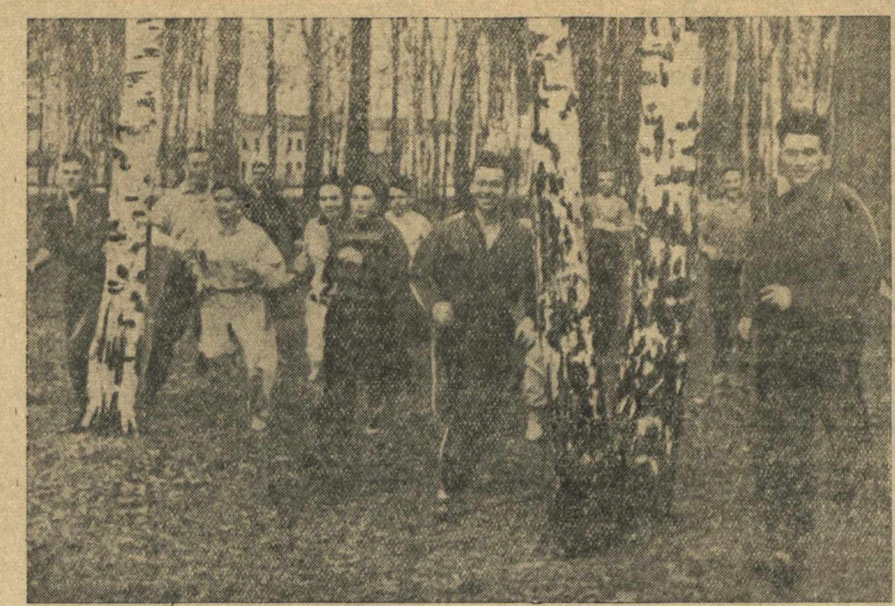
Сшел снег. Высохли дорожки и тропинки. Для физкультурников-бегунов наступила горячая пора. На снимке: бегуны-спортсмены «Торпедо» (автозавод им. Молотова) на тренировке в саду им. 1 мая.

БЕРЛИН, 27 апреля. (ТАСС). Югославский министр иностранных дел Маркович 26 апреля был принят Гитлером. В тот же день Маркович имел встречу с Герингом и вел с ним переговоры по вопросам германо-югославского сотрудничества.