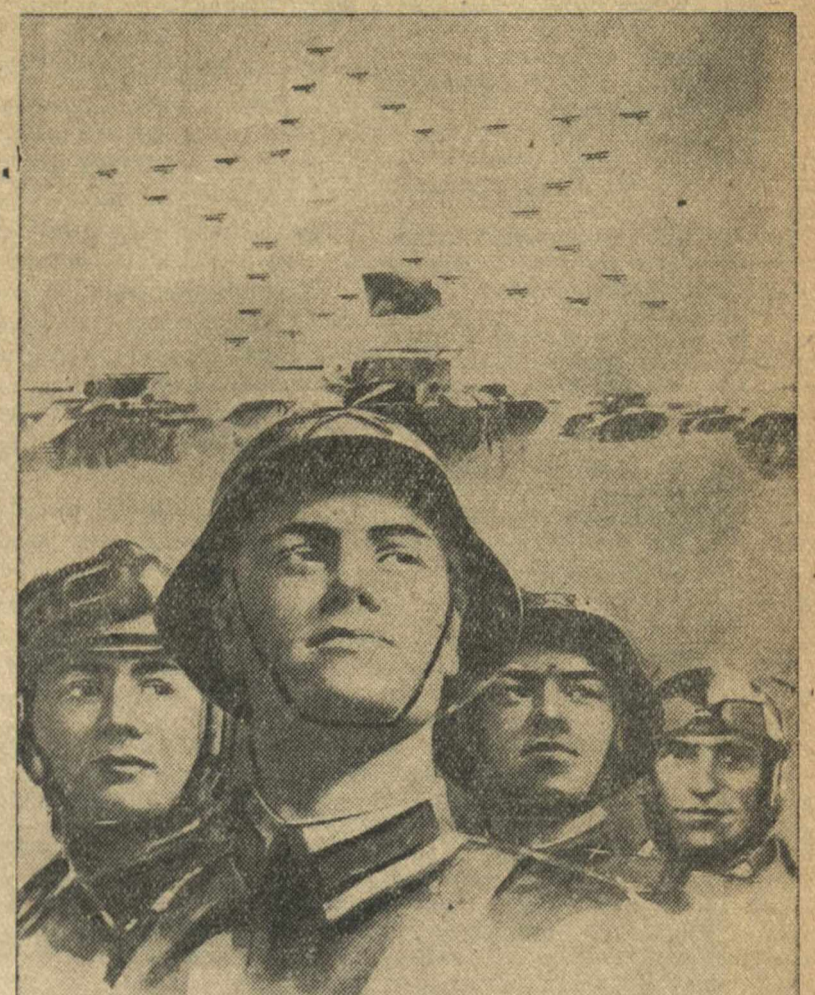
Воинская служба в Рабоче-Крестьянской Красной Армии предоставляет почетную обязанность граждан СССР.

Научно-исследовательский институт связи разрабатывает в настоящее время конструкцию автоматической телефонной станции, предназначенной для обслуживания телефонного жилого дома. Домовая АТС дает возможность без капитальных затрат расширить телефонную сеть. Если в доме имеется только 3—4 телефонных линии, то этого достаточно для установки 20 аппаратов.