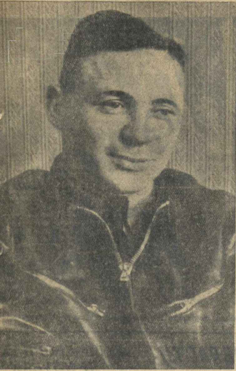
Герой Советского Союза В. К. Коккинаки.