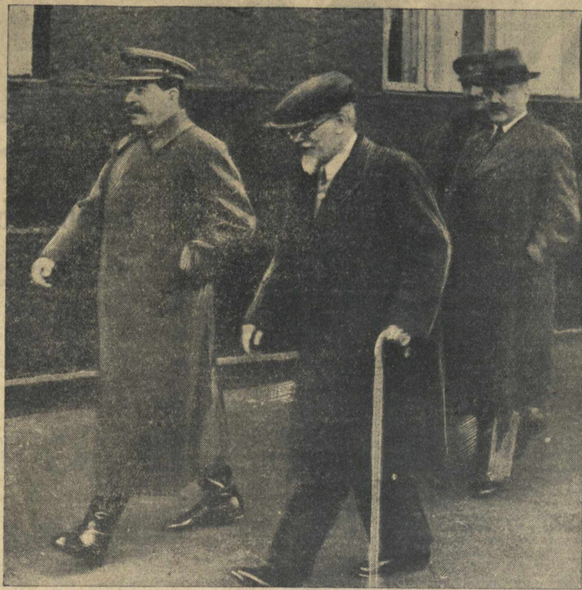
1 Мая 1939 года в Москве на Красной площади состоялся парад частей Рабоче-Крестьянской Красной Армии и Военно-Морского Флота и демонстрация трудящихся столицы. На снимке: товарищи И. В. Сталин, М. И. Калинин, Л. М. Каганович и В. М. Молотов направляются из Кремля на Красную площадь.