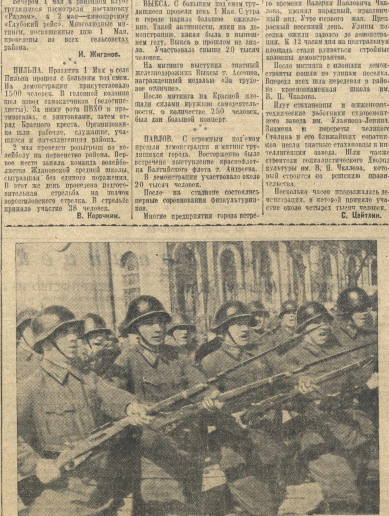
На первомайском параде частей горьковского гарнизона.