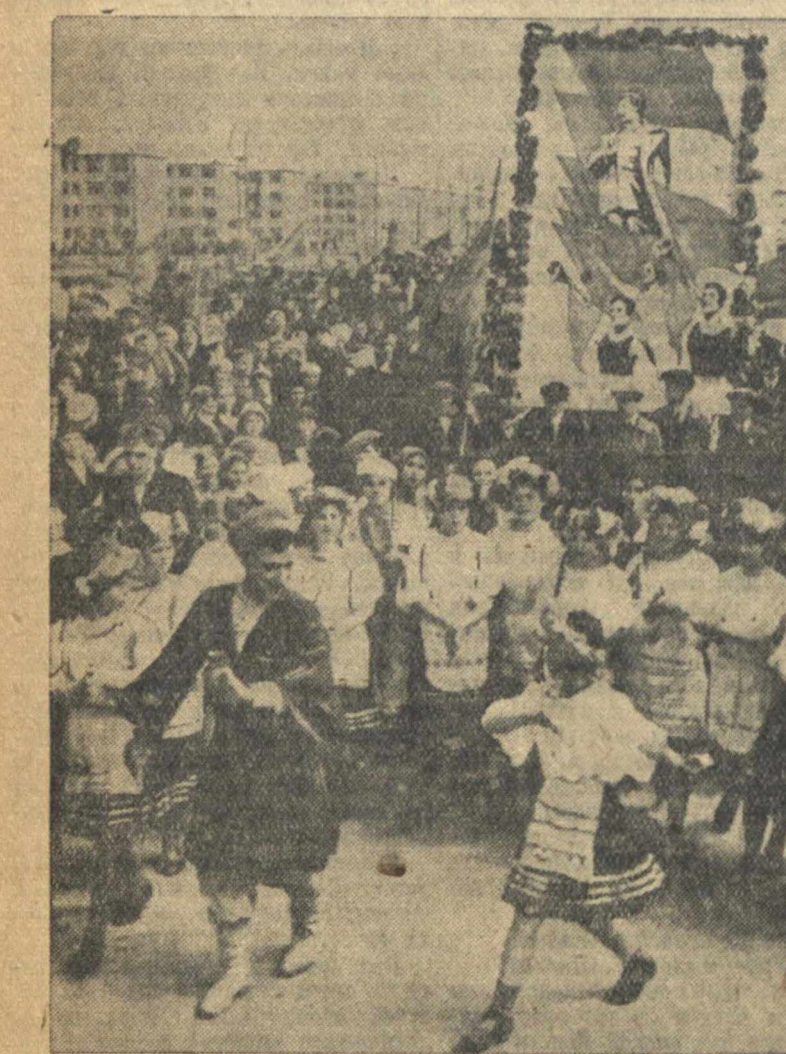
Первомайская демонстрация в Автозаводском районе.

ства Штаба Управлений Тихоокеанского Флота. За ней — курсанты Военно-Морского училища. Боевое море бескомпромиссно. Идут часовые Тихоокеанских глубин — подводники, командиры и краснофлотцы надводных кораблей. Мимо трибуны стройно проходят части Первой Отдельной Краснознаменной Армии: стрелки, пулеметчики, связисты, саперы. Пронеслись артиллерия разных калибров. Военный парад закончился. На улицу вступили колонны трудящихся. Над колоннами — многочисленные портреты товарища Сталина и его ближайших соратников, море алых знамен, плакатов, на которых начертаны слова горячей преданности коммунистической партии и родине. Несмотря на холодную погоду и дождь, в демонстрации приняло участие свыше 70 тысяч трудящихся Владивостока.