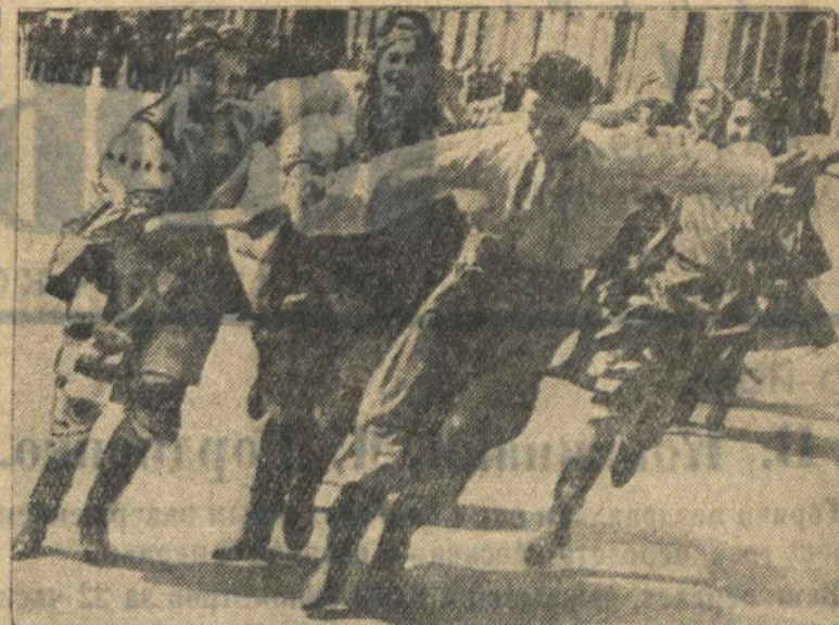
1 Мая в г. Горьком. На снимках (слева направо): колонна Сталинского района вступает на площадь Челюскинцев, парашютистки Ворошиловского района, участники детского оркестра мукомольного завода № 1 (Сталинский район) и пляска в колонне Ждановского района.