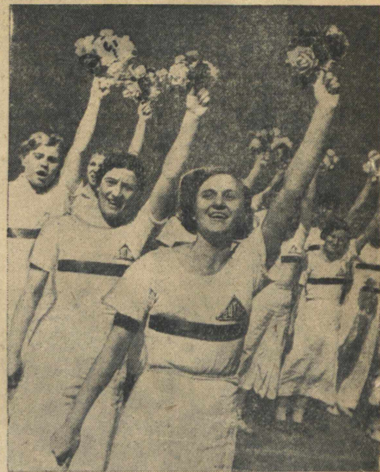
Первомайская демонстрация в г. Гольюм. На снимках (слева направо): в колонне Сормовского района, один из моментов спортивного выступления мотоциклистов областного автомотоклуба и студентки курсов инструкторов физкультуры (Сталинский район).