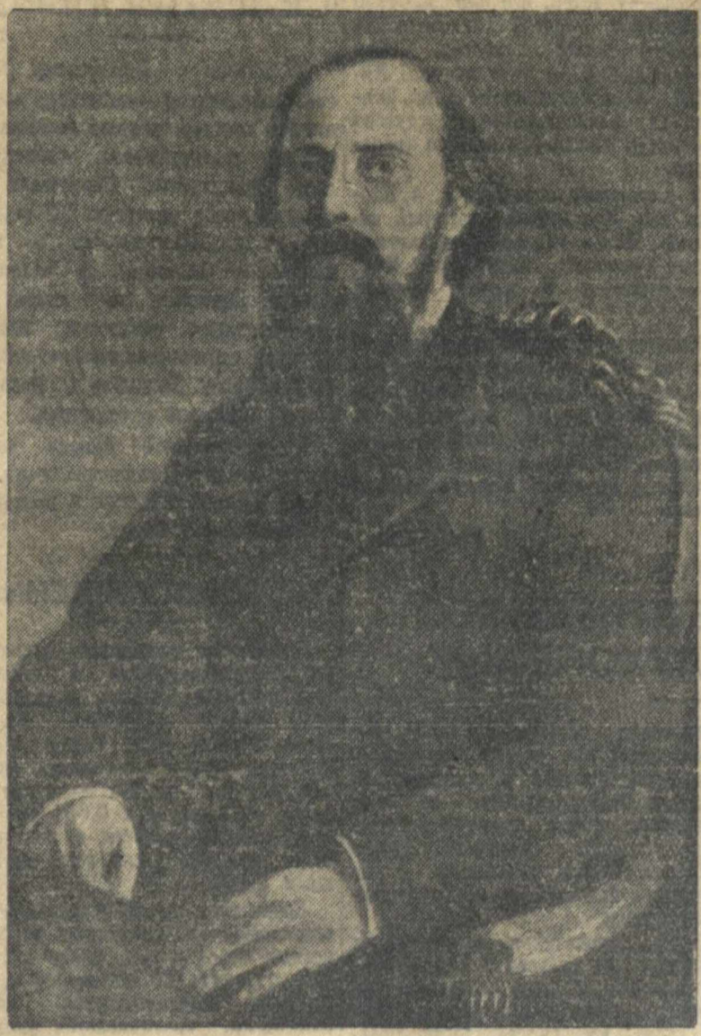
Высоко принципиальную борьбу с реакционерами, срывая все и всяческие маски с либералов.

1. В истории русского освободительного движения и русской литературы имя Михаила Евграфовича Салтыкова-Щедрина стоит рядом с такими главными предшественниками революционной социал-демократии, как Белинский, Чернышевский и Добролюбов. «Я не только литератор, — писал Щедрин, — но и журналист, человек партии. Революционно-демократическая партийность, горячая любовь к трудовому народу и защита его интересов, ненависть к насильникам трудящихся — составляют отличительную черту литературно-художественной и публицистической деятельности гениального сатирика дореволюционной России.