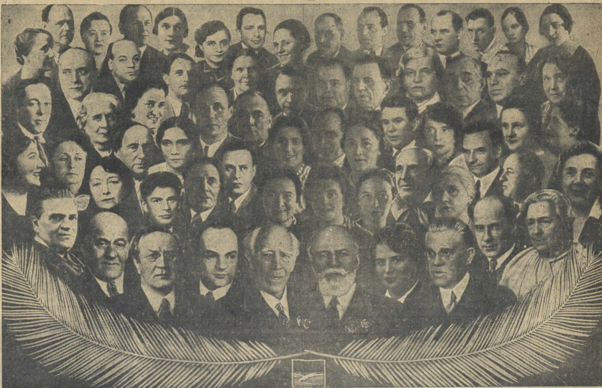
К приезду в г. Горький Московского Художественного Академического театра имени А. М. Горького.

С чувством искренней радости, мы приветствуем сегодня коллектив театра и от всей души говорим: «Добро пожаловать, дорогие товарищи! Пусть ваш приезд превратится в полновесный праздник советского искусства, длинный раз продемонстрирует величие и силу этого искусства, его крепкую неразрывную связь с народом и горячую любовь народа к его славным, замечательным мастерам».