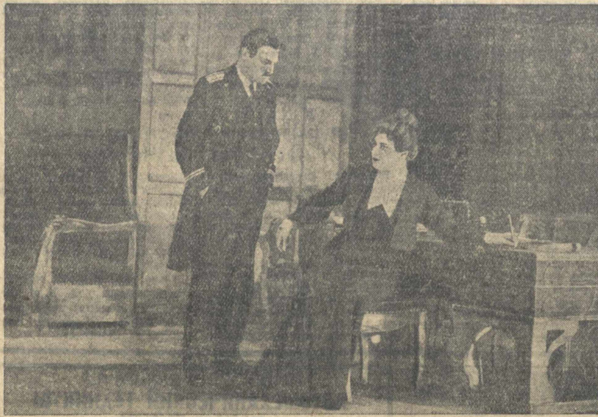
Сцена из 3 действия пьесы А. М. Горького «Враги» в постановке МХАТ. В роли прораб Сиробитова—народный артист СССР Н. П. Хмелев, в роли Татьяны—народная артистка СССР А. К. Тарасова.

отстаивала свое существование. И в Бранной площади почти ежедневно уходили на фронт отряды плохо вооруженных людей. В Москве было голодно, холодно, вставали трамваи, нередко почти весь город погружался во тьму—на электростанциях нехватало топлива. На переполненных вокзалах свистел трамвайный гудок.