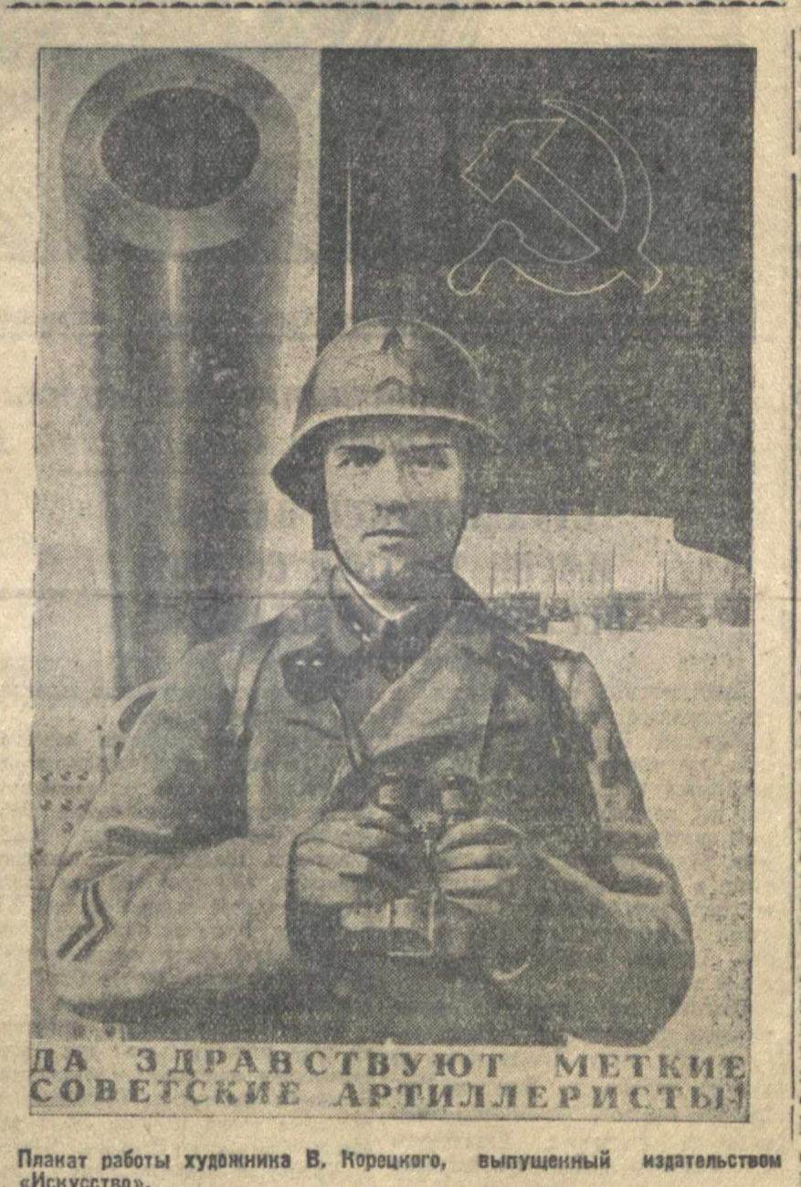
Планирует работы художника В. Корсакова, выпущенный издательством «Искусство».