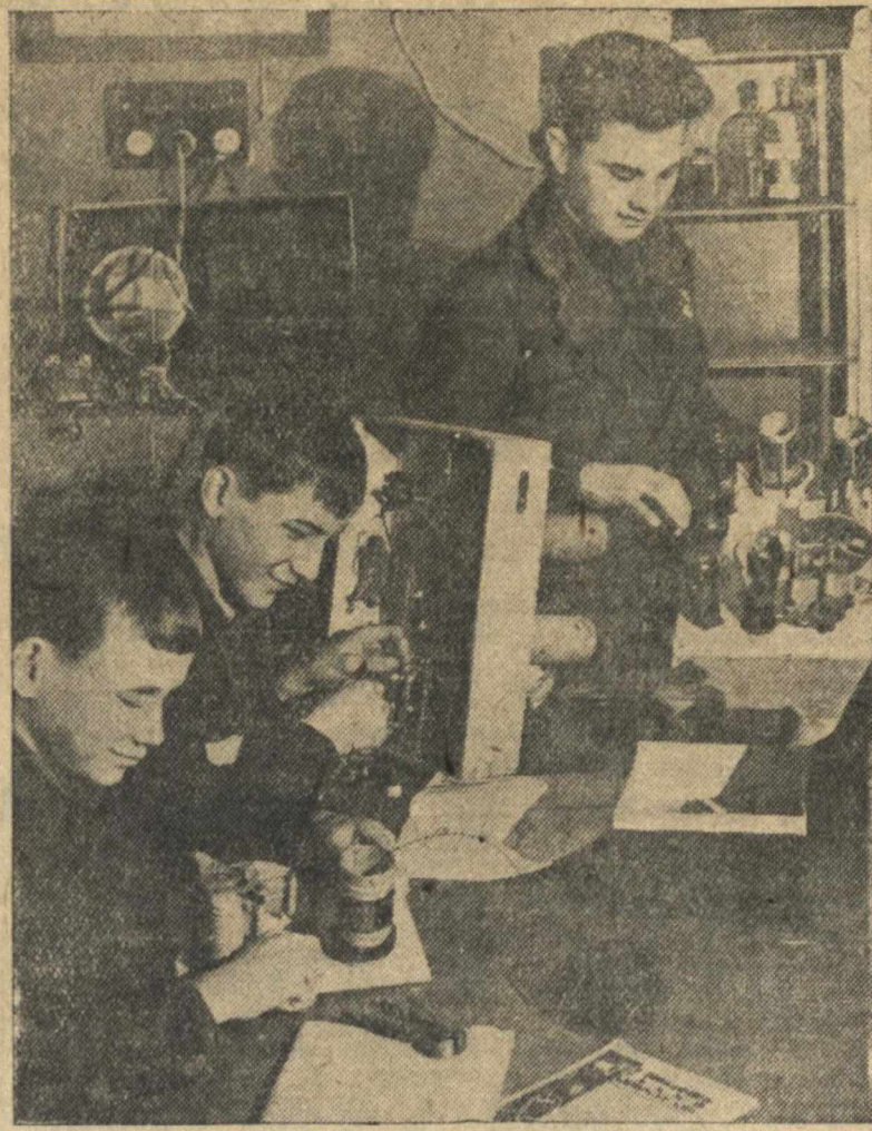
Радионабинец Богородского Дома пионеров пользуется большой популярностью среди школьников. Здесь постоянно работают уже опытные радиобинибелы и только еще начинающие знакомиться с радио.

Допущенные к испытанию получают об этом извещение, без которого выезжать в техникум не следует. Все справки и запросы о приеме направлять по адресу: Горький, Сормовский район, улица Баррикад, Машиностроительный техникум Дирекция. 1119