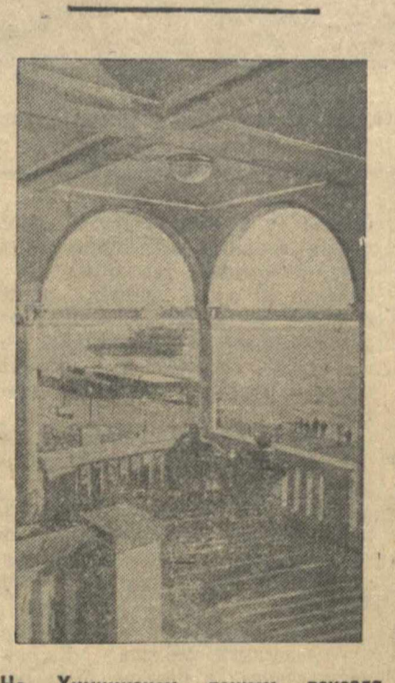
На Химкинском речном вокзале канала Москва-Волга.