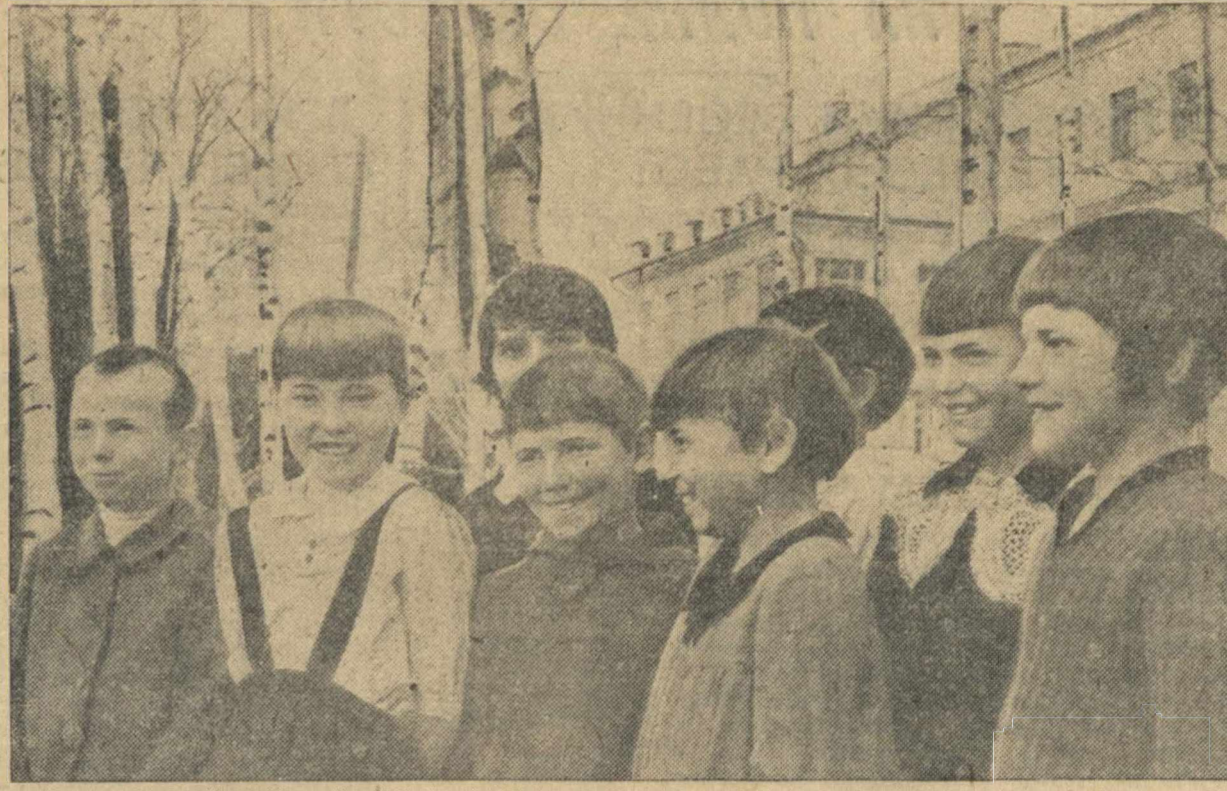
Учебный год закончен. У многих тысяч малышей начались летние каникулы. На снимке: группа отличников учебной школы № 114, Ворошиловского района, перешедших в третий класс.

ЛОНДОН, 16 мая. (ТАСС). Как уже сообщалось, японский генеральный консул в Амоэ предъявил ряд требований муниципальному совету международного селтэмента в Гулансу, принятие которых будет означать установление полного японского контроля над селтэментом.