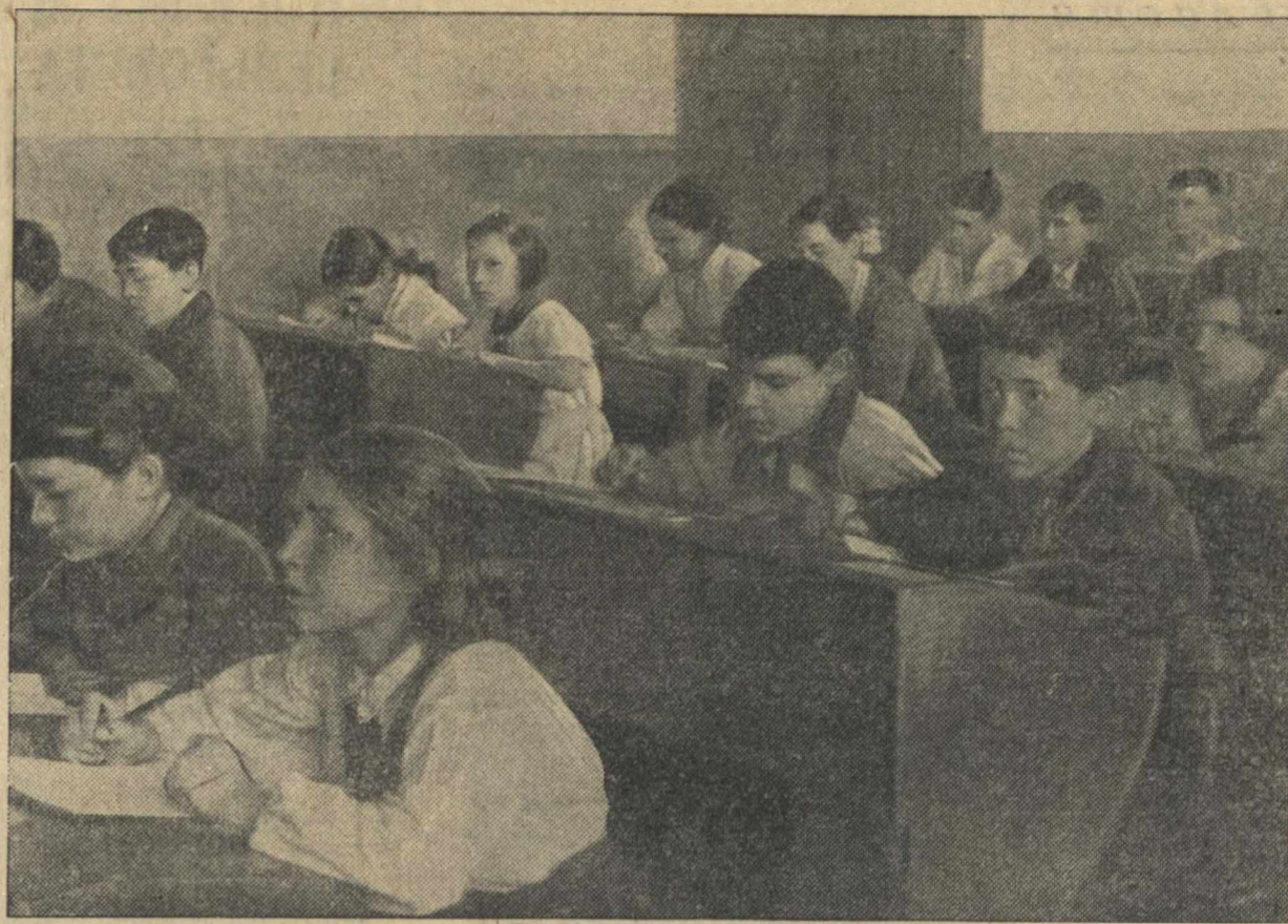
Начались школьные испытания. — На снимке: в 6-м классе «В» школы № 4 Свердловского района на письменной работе по алгебре.

НЬЮ-ЙОРК, 21 мая. (ТАСС). Авиационная компания «Панамерикан Эйрлайнс» намечает в июне открыть регулярное пассажирское сообщение из США в Европу на крупнейших летающих лодках типа «Инки Клиппер». Рейсы будут совершаться дважды в неделю по двум трассам: южной — через Азорские острова — Лиссабон и Марсель в Саутгемптон и северной — через Ботууд (Ньюфаундленд) и Фойнс (Бразилия) в Саутгемптон.