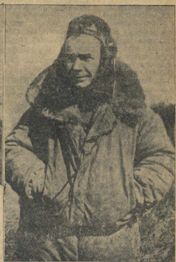
Вчера в Москву возвратились отважные сталинские соколы товарищи В. К. Коккинаки и М. Х. Гордиенко, совершившие героический беспосадочный перелет из Москвы в Северную Америку. На снимках: в центре — самолет «Москва» на острове Мискоу; слева — Герой Советского Союза В. К. Коккинаки и справа — М. Х. Гордиенко на острове Мискоу.