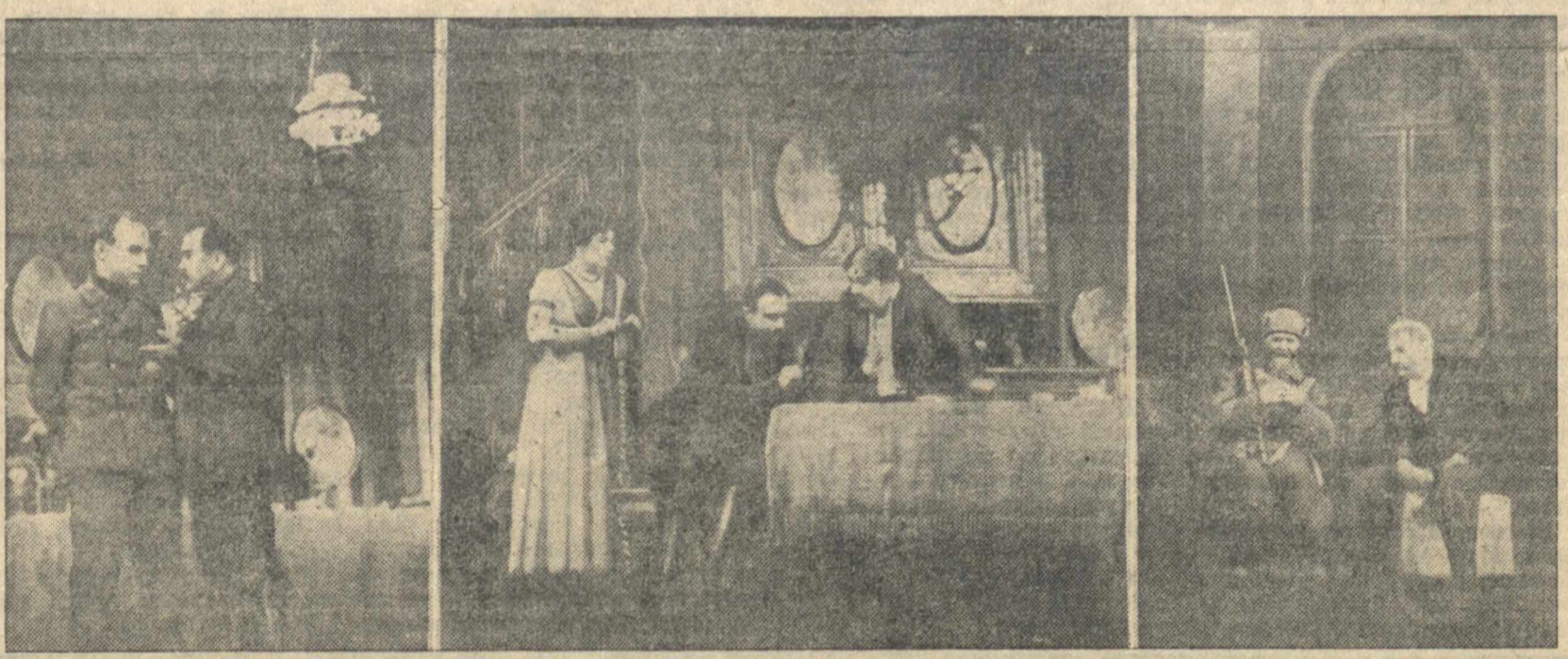
Сцены из пьесы А. М. Горького «Достигаев и др.» в постановке МХАТ.

Эта была школа, потому что великодушные мастера старшего и среднего поколений и талантливая молодежь Художественного театра показали нам подлинную сценическую правду, чувств, исключительное мастерство театра, основанное на глубокой мысли, идейности искусства. Более того, вы, как истинные друзья, в товарищеских