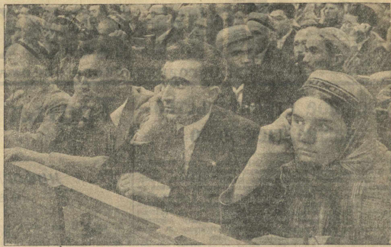
Третья Сессия Верховного Совета СССР. На снимке: В Большой Кремлевском Дворце на первом совместном заседании Совета Союза и Совета Национальностей.