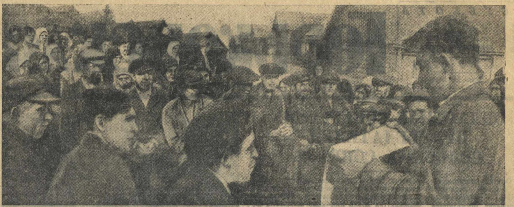
Общественное собрание колхозников Миршенского колхоза «Ударник», Дальне-Константиновского района, посвященное обсуждению постановления Центрального Комитета ВКП(б) и Совета Народных Комиссаров СССР «О мерах охраны общественных земель колхозов от разбазаривания».