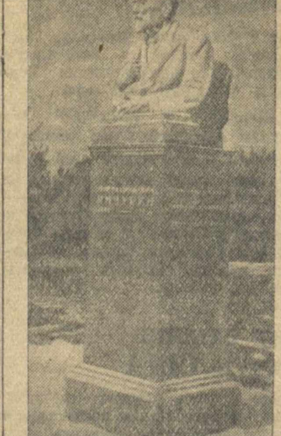
Памятнику гениальному русскому селекционеру Ивану Владимировичу Мичурину, открытый 6 июня 1939 г. в Мичуринске.