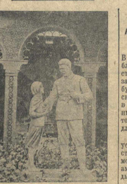
На строительстве Всесоюзной сельскохозяйственной выставки. Скульптура товарища Сталина в девичьем Мамляте, установленная в выставочном зале павильона Таджикской ССР.

Шесть угольных пластов кураховского месторождения толщиной до 2 метров и протяжением до 3 километров каждый смогут питать газом электростанцию мощностью в 24 тысячи киловатт в течение 35 лет. Электростанция будет получать в сутки до 3 миллионов кубометров дешевого газа. Электроэнергия, вырабатываемая комбинатом, будет стоить в два с половиной — три раза дешевле, чем на обычной тепловой электростанции.