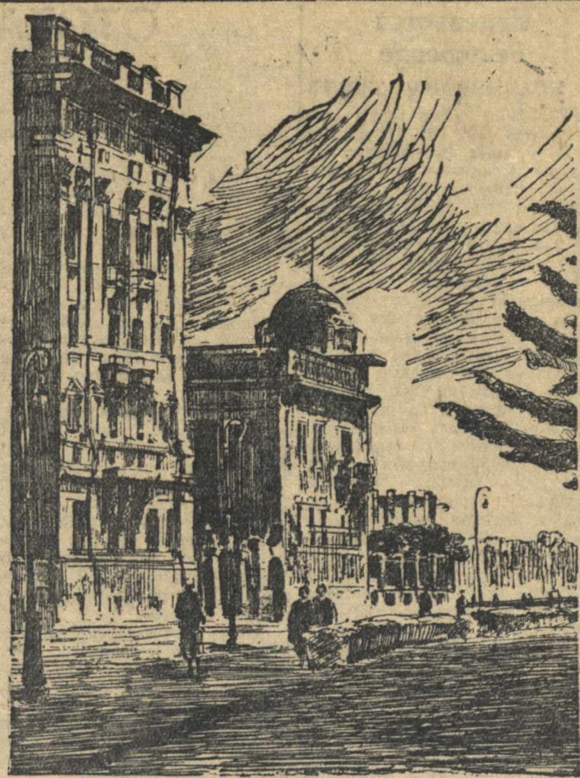
Музей С. М. Кирова в Ленинграде.