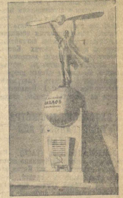
Проект памятника под девизом «Звезда Высокова».

Этот далеко не полный перечень работ, конечно, не охватывает всего разнообразия выставок. На ней представлено также несколько детских работ. Дети, как всегда, не остались равнодушными к такому большому делу и участвуют в конкурсе доступными им средствами. Имеются и просто письменные предложения об идее памятника.