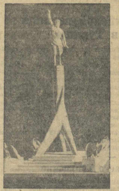
Проект памятника под девизом «Орел».

12 июня в коммунальном музее г. Горького (бывш. Строгановская церковь) открылась выставка проектов памятника В. П. Чкалову, который предполагается поставить в с. Высоково. Конкурс на проект памятника организован архитектурно-планировочным управлением горсовета.