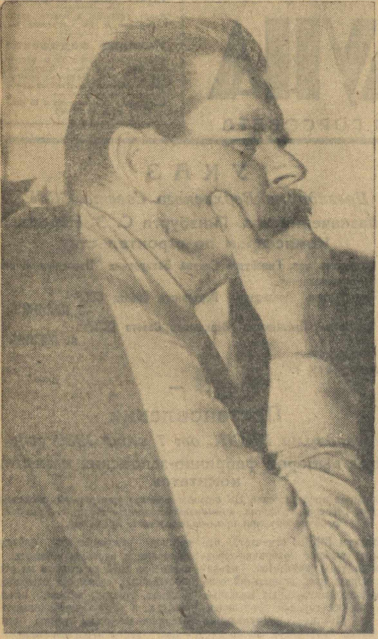
А. М. ГОРЬКИЙ. (Один из последних снимков).