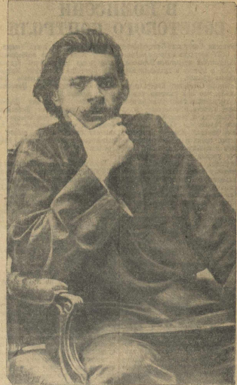
А. М. Горький (1902 г.)—в период первой постановки пьесы «На дне».