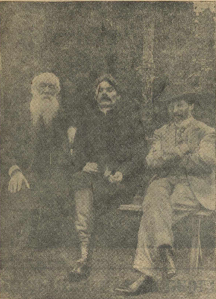
М. Горький, В. Стасов и И. Репин. (1906 г.).