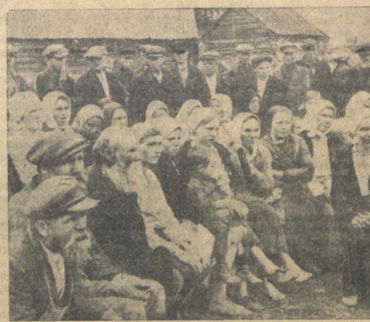
На общем собрании колхозников с. х. артели им. Кирова (Истовский район), посвященном обсуждению постановления Центрального Комитета ВКП(б) и Совета Народных Комиссаров СССР «О мерах охраны общественных земель колхозов от разбазаривания».