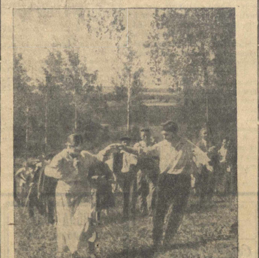
На колхозном гуляньи в с. Кужутки, Д-Константиновского района.

легковых машин и автобусов. За рекой, в живописной березовой роще, расцветившейся кустов флагов и привлекательных дозунков, украшенных портретами волей, раскинулись многочисленные палатки торгующих организаций, подмостки для эстрадных выступлений, парикмахерская и т. д. Здесь обстановка не менее патентовидна тысяч колхозников и колхозниц Далеко-Константиновского района, станочники промышленного предприятия Ворошиловского района города Горького, курсанты военно-политического училища им. Фрунзе.