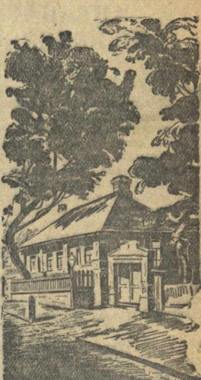
Бытовой музей детства А. М. Горького—«Домик дедушки» в поселке Ташино.