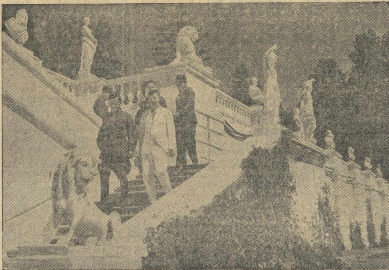
Командиры РККА на отдыхе. На снимке: группа отдыхающих командиров в доме отдыха наместника РККА «Архангельское».

По сообщению американского журнала «Найтен», до марта 1938 года в Германии было уволено 1.684 профессора по причинам происхождения, политической неблагонадежности. Многие профессора покинули Германию в знак протеста против гонений германского фашизма на культуру и интеллигенцию.