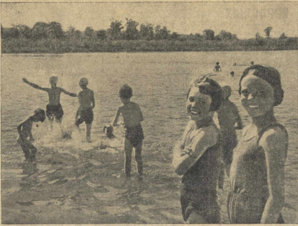
На Волге у Моховых гор.

жения и огромных удержаний из заработной платы. За последние 15 дней из зарплат рабочих удерживался на питание и квартиру 85 марок.