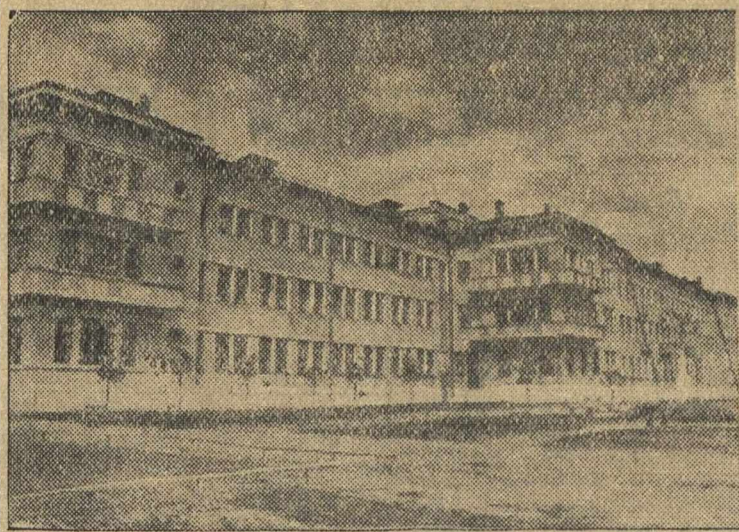
Вчера состоялось торжественное открытие новой областной детской клинической больницы в г. Горьком. На снимках: 1. Внешний вид больницы. 2. Одна из палат. 3. Физioterпевтический кабинет.

ЛОНДОН, 8 июля. (ТАСС). Английские корреспонденты в Дании сообщают, что военные приготовления в этом городе продолжаются. Специальный корреспондент газеты «Дейли телеграф энд морнинг пост» в Дании передает, что вчера поздно вечером было установлено 8 пулеметов в домах, расположенных близ входа на территорию судостроительной верфи Шихау, которая становится главным арсеналом датских фашистов. Далее корреспондент сообщает, что вчера в казармах «Добровольческого корпуса» в Лансфуре (пригород Дании) сотни молодых людей проходили медицинский осмотр.