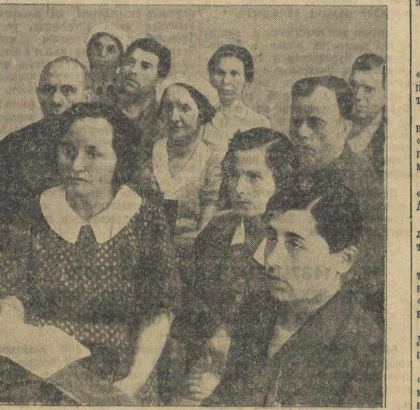
На теоретической конференции в промкомбинате Куйбышевского района.