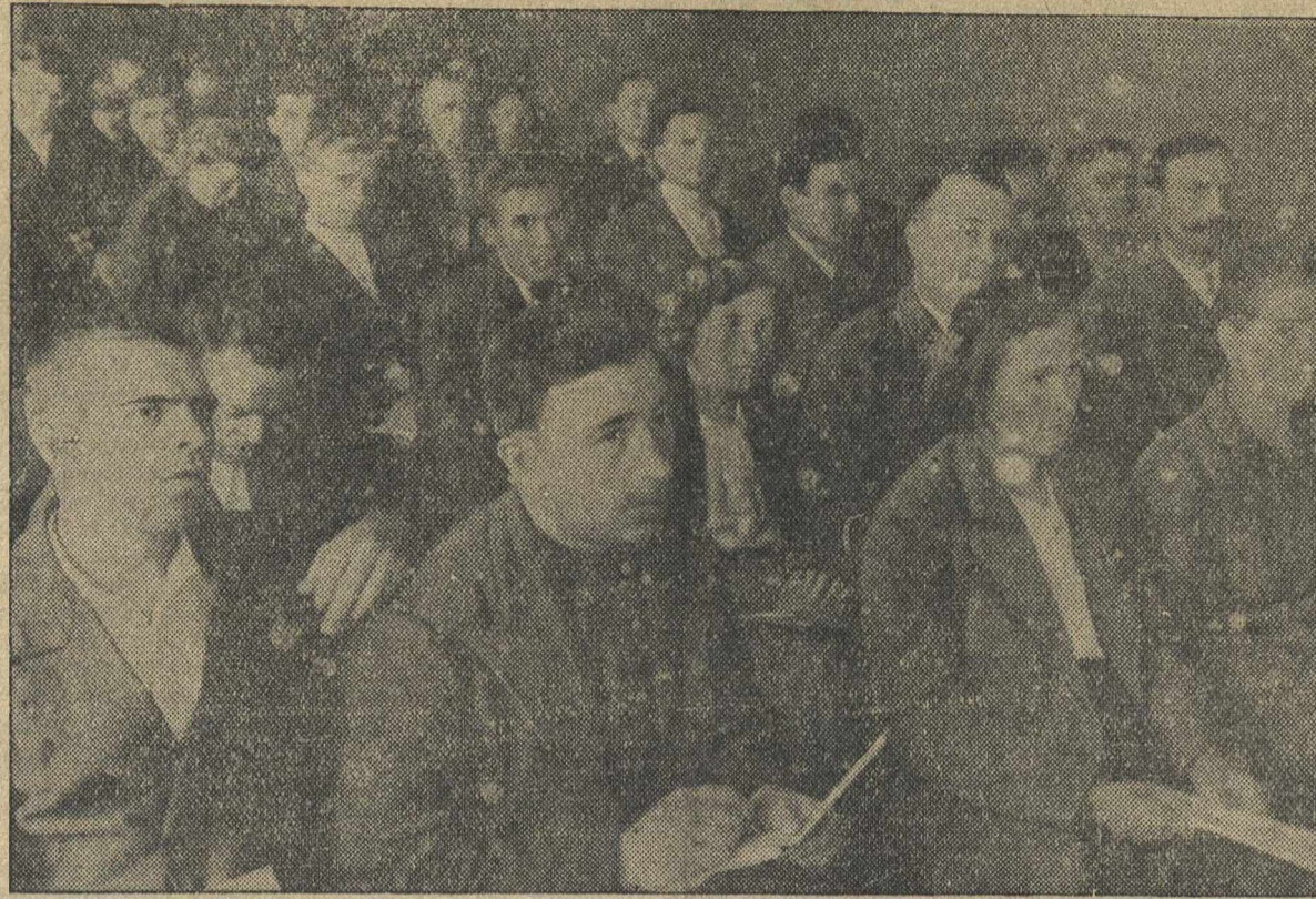
На областном совещании актива газеты «Горьковская коммуна».