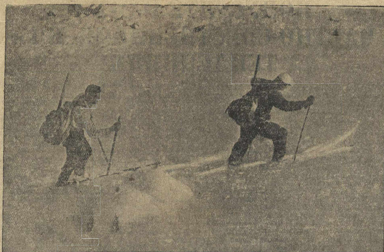
Круглый год алмазинские альпинисты имеют возможность совершать лыжные вылазки на снеговые массивы Замлиинского Ала-тау. На снимке: лыжники на леднике Туяк-су. Фото Д. Саланова. (Фотохроника ТАСС).

Главные предметы экспорта: шерсть, кожа, масло, финики и скот. В Саудовскую Аравию ввозятся чай, сахар, текстильные изделия, керосин. Промышленности в Аравию. (ТАСС).