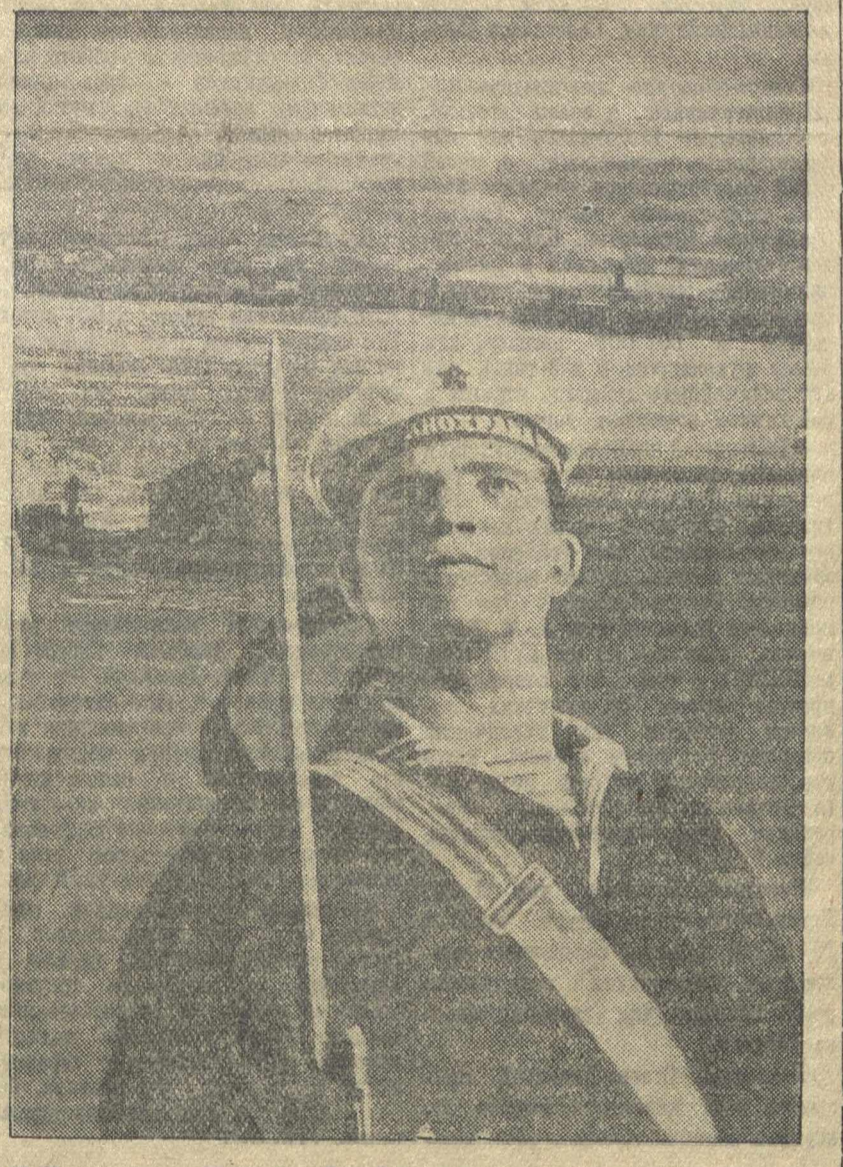
На стране священных советских гор ниц. («СССР на строе»).