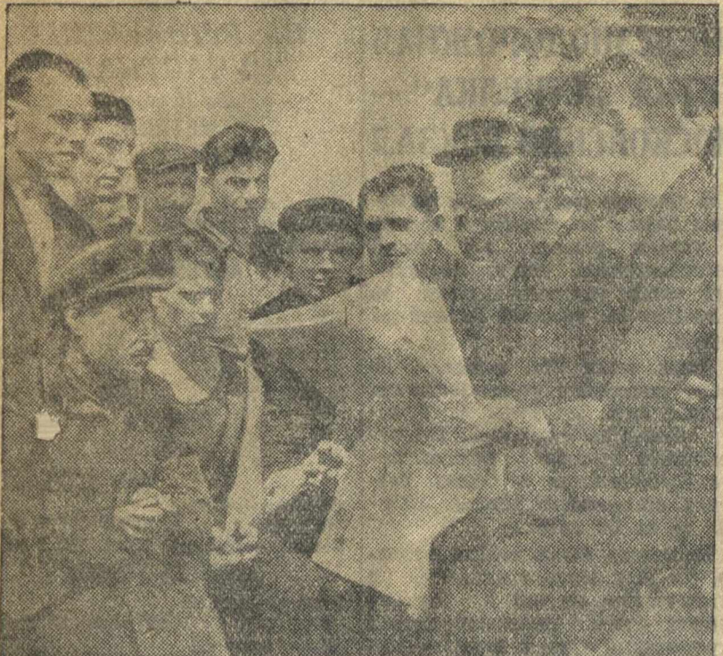
Рабочие научно-литейного цеха завода «Красный металлист» в обеденный перерыв слушают чтение своей газеты.