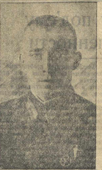
Отличный стрелок, комсорг тов. Максимум.