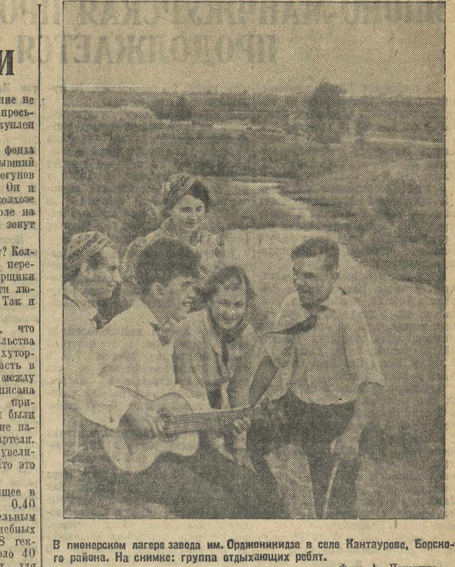
В пионерском лагере завода им. Орджоникидзе в селе Кантаурово, Борского района. На снимке: группа отдыхающих ребят.

Однако, сейчас, как это заявляют американские газеты, все более