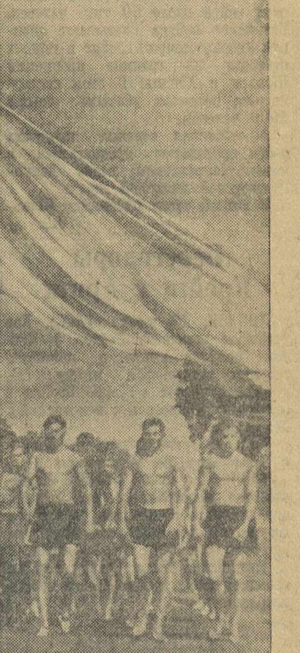
Стройными колоннами пройдут сегодня по улицам нашего города тысячи мужественных юношей и девушек, готовых к труду и обороне.

18 июля — всенародный смотр достижений и успехов советских физкультурников, день проверки мобилизационной готовности советской молодежи. В этот день на Брасную площадь, как и в прошлые годы, выйдут физкультурники одиннадцати братских республик. С песнями будет шагать ликующая молодежь, приветствуя великого вождя народов — лучшего друга физкультурников товарища Сталина.