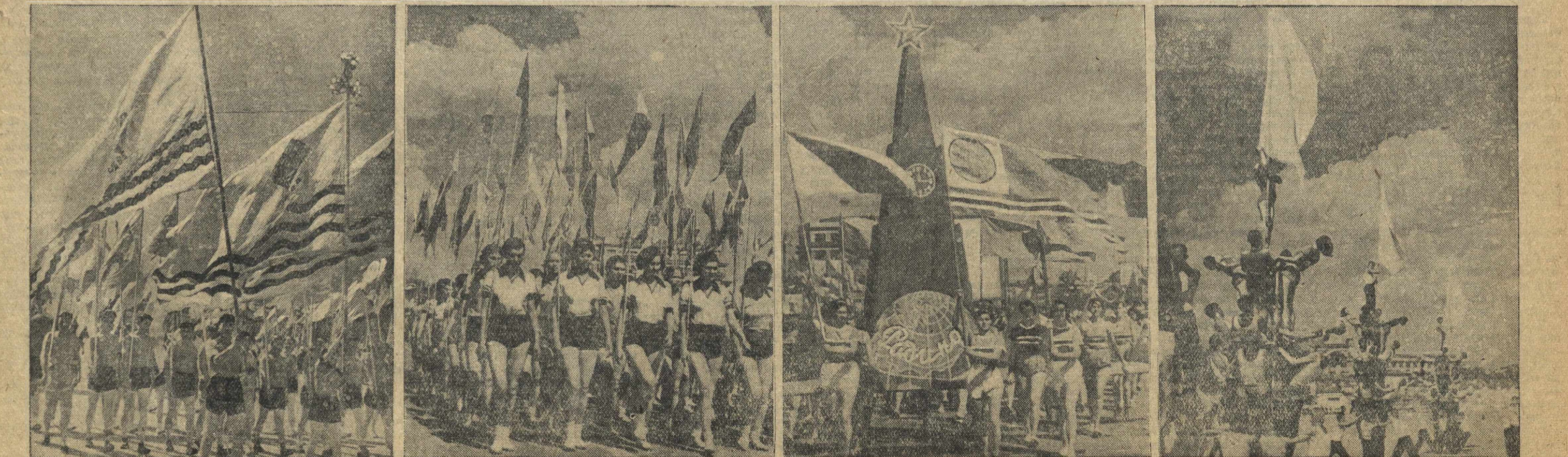
Общегородской физкультурный парад 18 июля в гор. Горьком. Прохождение колонн спортивных обществ (слева направо): «Водник», «Металлист», «Родина» и момент выступления студентов техникума физкультуры им. В. П. Чкалова.