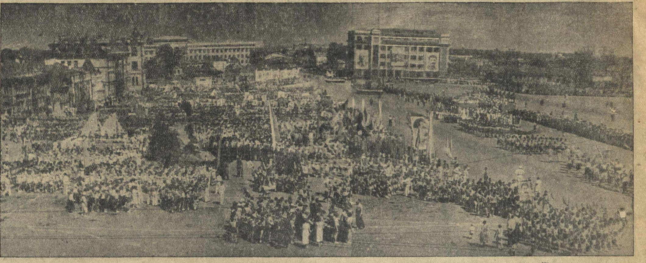
Общий вид площади им. 1 мая во время общегородского физкультурного парада в гор. Горьком 18 июля.