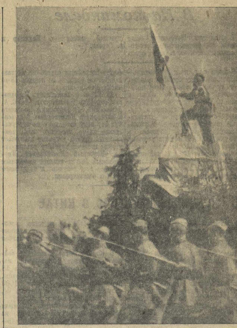
Общегородской физкультурный парад 18 июля в гор. Горьком. В колонне орденоносного спортивного общества «Динамо».

М. ЛЕВИН. Колхоз «Путь крестьянина», Межевский район.