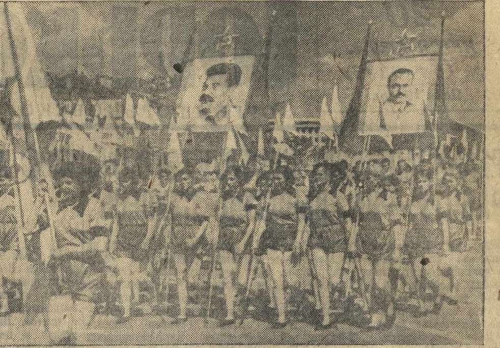
Общегородской физкультурный парад 18 июля в гор. Горьком. В колоннах спортивного общества «Пламя» и орденоносного спортивного общества «Спартак» (в центре).