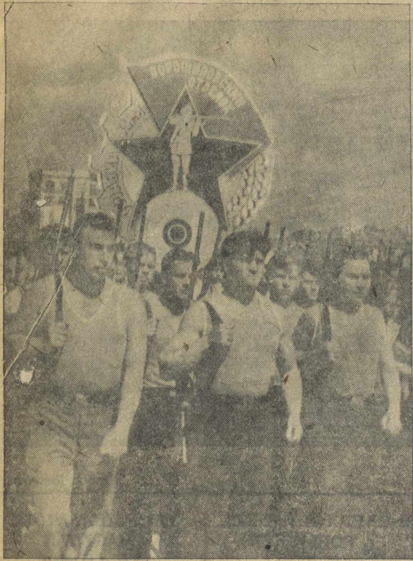
Общегородской физкультурный парад 18 июля в городе Горьком. На снимке: стрелки-осовиахновцы.