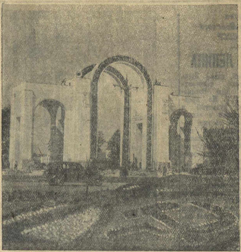
На строительстве Всесоюзной сельскохозяйственной выставки. На снимке: арка при входе на выставку.