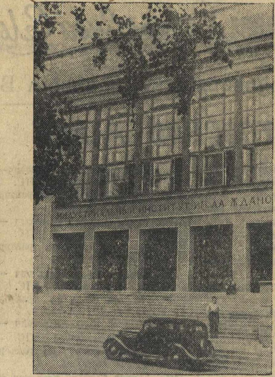
Город Горький. У входа в индустриальный институт имени Жданова.

Телефоны редакции: общий—3-12-60; отв. редактор—3-01-94; зам. отв. редактора—3-26-18; отв. секретарь—3-29-71; 3-55-91; отдел пропаганды—3-26-07; отдел партийной жизни—3-24-33; 3-24-46; информация и иллюстрационный—3-50-31, промышленно-транспортный—3-50-29, река—4-09; сельхозхоз.—3-35-74; совхозско-торговый, литературы и искусство—3-46-99; культура—3-43-04; шоссей и рабсельхозов—3-30-29, 3-43-48; издательство—3-45-08; отдел объявлений—3-30-11.