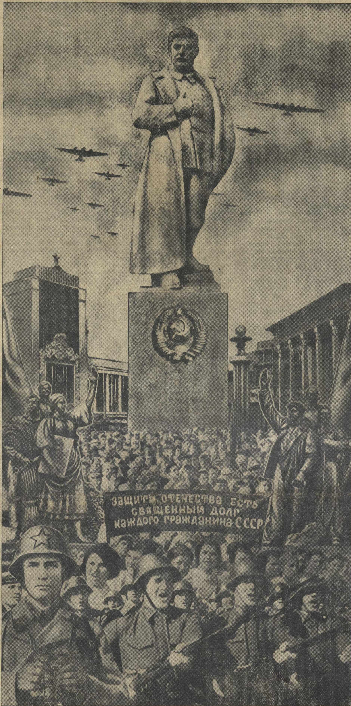
Композиция Н. Головина.

Да здравствует союз людей стахановской практики и людей передовой науки, совместные усилия которых обеспечат дальнейший, все более высокий подъем социалистического земледелия!