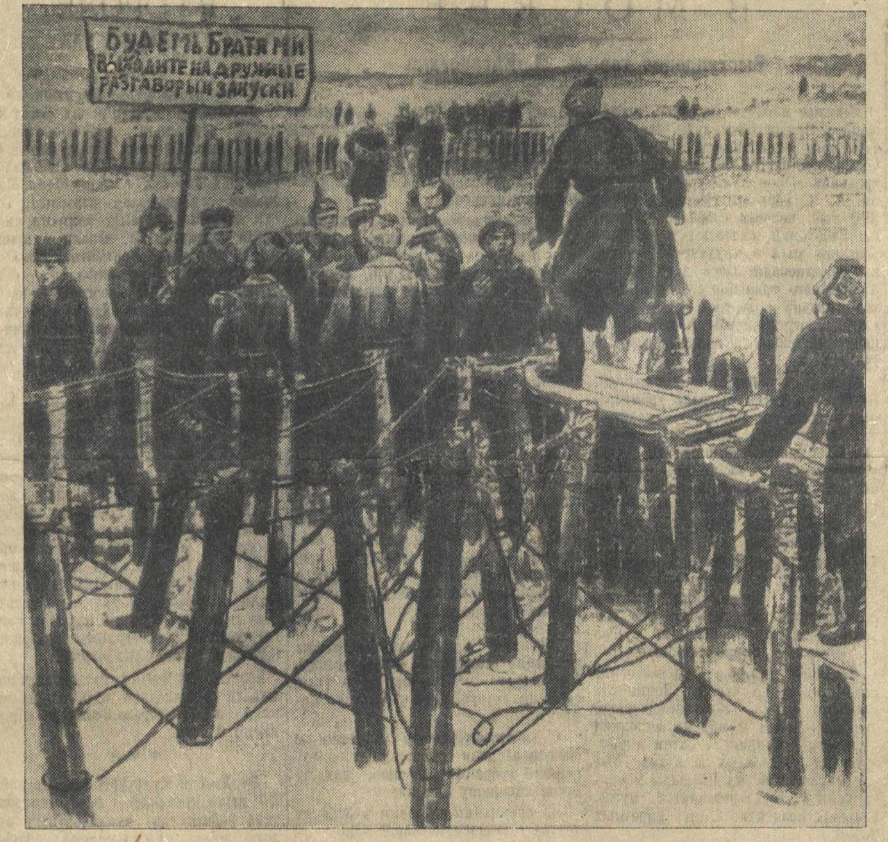
БРАТАНИЕ. (Рисунок И. Владимиров из I тома «Истории гражданской войны в СССР»).

Решающие бои между армиями империализма в 1918 г. развернулись на Западном фронте. Между тем, на востоке была скопана громадная германская армия, которую нельзя было использовать для борьбы против Антанты. Подмалюно немецких оккупационных войск стояло на Украине. В это время «Против иноземного ига, идущего с Запада, Советская Украина подымает освободительную отечественную войну...» (Сталин, статьи и