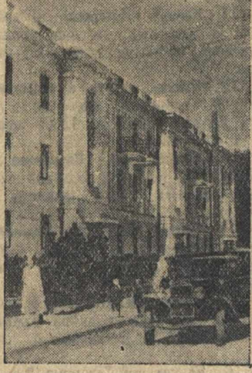
Благоустройство г. Богородска. На снимках: в центре на центральной площади города и один из новых домов фабрики имени Карла Маркса.