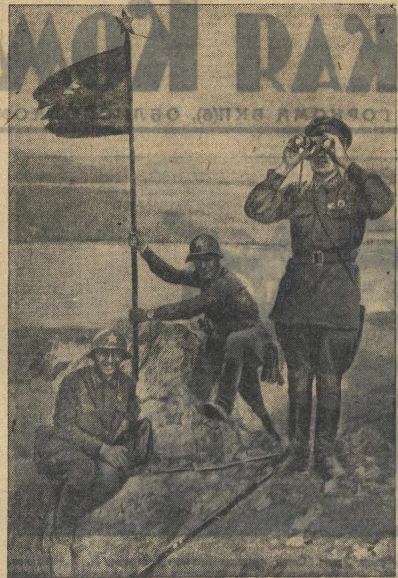
Командиры-дальневосточники устаналивают на высоте Заозерной красный флаг, пробитый пулями и осколком гранаты.

Не нужно быть пророком, чтобы предсказать фашистам Запада и Востока исход их агрессивных авантюр. До сих пор, пренебрегая неудачами с точки зрения тактики боя, мы сражались на своей земле и не подавались на уловку провокаторов войны, не вторгались на чужую землю. Но у советского народа есть мера терпения. И бои у Хасана покажутся японцам «цветиком», когда они своими наглыми провокациями вынудят нашу армию дать бой на территории наших противников. Тогда-то японцы узнают, что значит «огонь», о которых говорил наш народ товарищ Ворошилов. И тогда «благословенное» самурайское лето покажется им, как говорится по-русски, с оценкой. А на земле от советской пехоты, танков и артиллерии зарвавшиеся японки не найдут себе ни места, ни покоя.