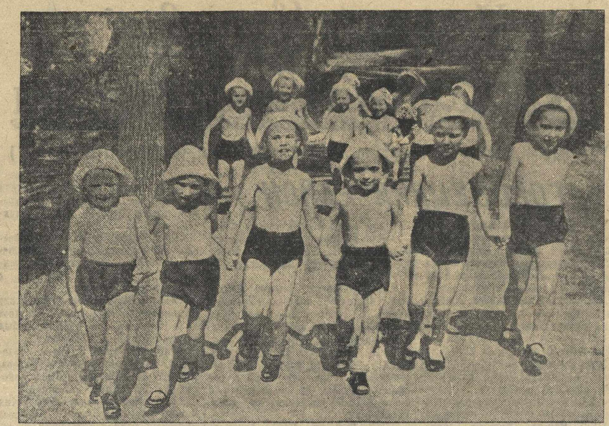
Дети из детского сада фабрики № 2 имени А. А. Мядова на прогулке.

Совет профсоюзных городов Виннипег (Канада) принял резолюцию, в которой призывает к бойкоту товаров стран-агрессоров и требует от канадского правительства расследования шпионской деятельности германских фашистов в Канаде.