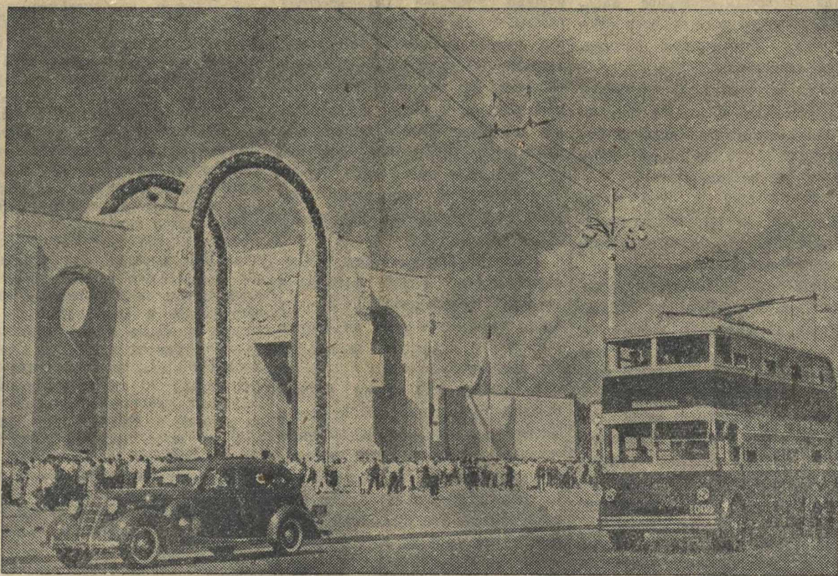
На Всесоюзной сельскохозяйственной выставке. Центральный вход на выставку.

Комсомол села должен энергичнее включиться в государственную и хозяйственную деятельность; стать еще более активным помощником коммунистической партии в деле укрепления колхозов, в деле дальнейшего развития социалистического сельского хозяйства.