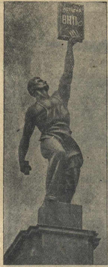
На Всесоюзной сельскохозяйственной выставке. На снимке скульптура, установленная у павильона

*) Продолжение. См. «Г. К.» за 11 августа. (Продолжение следует)