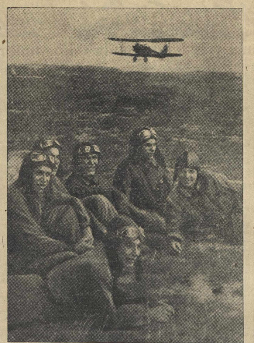
Горьковский аэроклуб им. Баранова. Улеты наблюдают за полетами.

Газета «Иллюстрации курьер подонный» сообщает, что Рузвельт якобы в своем письме, переданном Молотову послом Шлейнгардом, предлагает сотрудничество с Советским Союзом на Дальнем Востоке против японской экспансии и обещает гарантии Америки Советскому Союзу на случай войны с Японией, при условии подписания Советским Союзом военного союза с Англией и Францией, а также и экономическую помощь Китаю в борьбе против Японии и что якобы для обсуждения этих вопросов Рузвельт готов послать в Москву специальную делегацию после подписания Советским Союзом павта с Англией и Францией. ТАСС уполномочен сообщить, что все это сообщение газеты «Иллюстрации курьер подонный» является сплошным вымыслом от начала до конца.