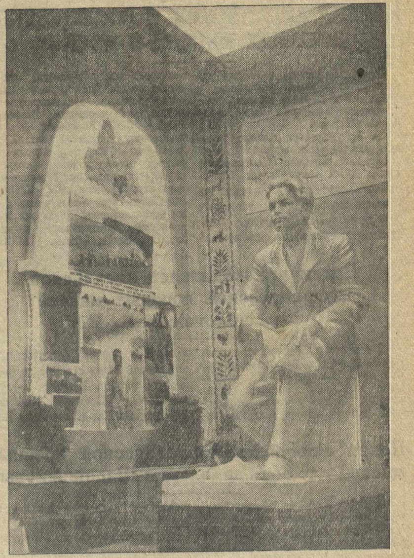
Всесоюзная сельскохозяйственная выставка. Скульптура «Юноша Киров» за печатанием революционных прокламаций работы скульптора Винокуровой (зал Кировской области).