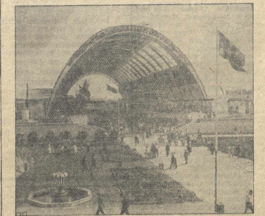
Бессоюзная сельскохозяйственная выставка. Павильон «Механизация».

Сейчас тов. Полагутин стал крупным знатоком механизации сельского хозяйства.